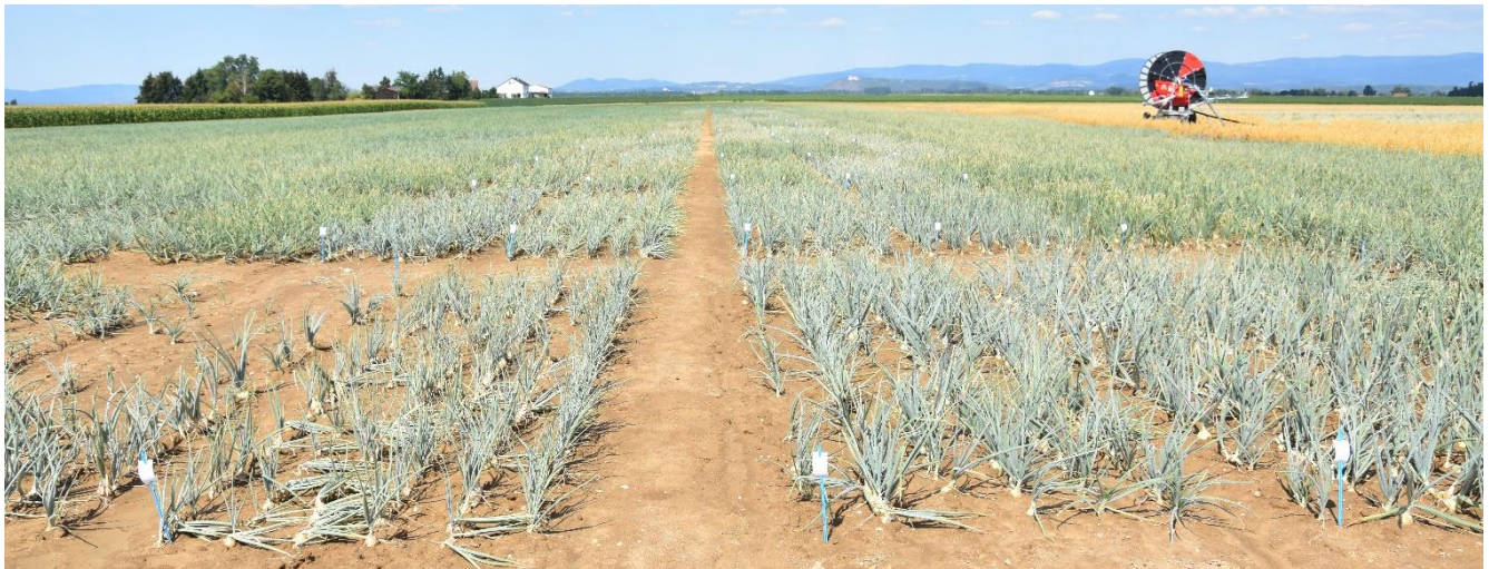
Bild 1: Von Trockenheit geprägter Sortenversuch

In den Zwiebelherzen wurden zu einer Zeit teilweise wieder Neuaustriebe beobachtet, in der die Zwiebel vorwiegend abschließen sollte. Ohne Feldtrocknung gingen alle drei Reifegruppen Anfang September ins Lager. Bei der Ertragsermittlung zeigte sich ein hoher Anteil in der Sortierung 35 bis 40 mm.