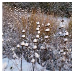
Silbersommer im Winter

2. aktualisierte Auflage, Bundesinformationszentrum Landwirtschaft (Hrsg.), ISBN/EAN 978-3-8308-1292-0, 148 S. Download unter: www.ble-medienservice.de .