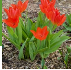
Tulipa praestans 'Füsilier'