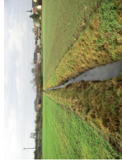
Gewässer ohne Gewässerrandstreifen