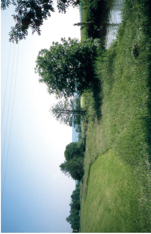
Gewässerrandstreifen mit Beschattung für das Gewässer

Durch die Ausgleichsregelung erhalten Landwirte in den ersten 5 Jahren 500 Euro pro Hektar und Jahr und in den darauffolgenden Jahren 200 Euro pro Hektar und Jahr. Die Abwicklung der Ausgleichszahlungen erfolgt über die Landwirtschaftsverwaltung. Ansprechpartner sind die Ämter für Ernährung, Landwirtschaft und Forsten. Anträge können immer ab Mitte März im Rahmen des Mehrfachantrags gestellt werden.