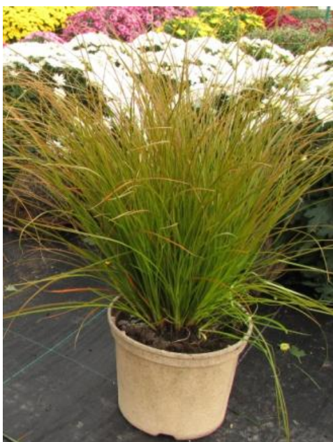
Abb. 6: Carex testacea 'Prairiefire', NaturePot 30.09.09