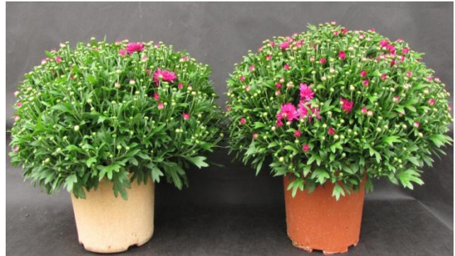
Abb. 3: Chrysanthemum 'Bransky Lilac' 04.09.09 Links: NaturePot; Rechts: Kunststofftopf