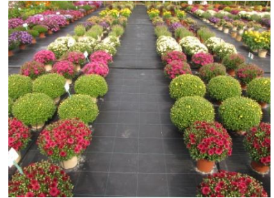
Abb. 1: Bestand im Freiland Links: NaturePot Rechts: Kunststofftopf

Als naheliegende Ursache hierfür werden die wasser-durchlässigen Topfwände des NaturePots angesehen, über die Wasser verdunstet wird und so das Substrat nach der Bewässerung zügiger abtrocknet. Während der 12-wöchigen Kultur im Freiland, auf Mypex-Folie stehend, bildete sich weder Pilz- noch Algenbewuchs, der optische Zustand des NaturePots wurde durch die Witterungseinflüsse nicht beeinträchtigt.