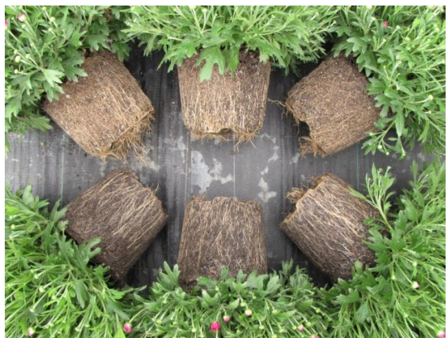
Abb. 5: Chrysanthemum 'Bransky Lilac' 04.09.09 Oben: NaturePot; Unten: Kunststofftopf