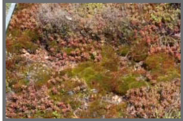
Bild 2: Nach 5 Jahren dominieren Moos und Sedum album den Begrünungsaspekt. Für manche Anbieter resultiert daraus ein im wahrsten Sinne des Wortes "schwerwiegendes" Problem...

und schlagen deshalb bei Unterhaltungsaufwand auch nicht zu Buche. Die vorliegenden Testergebnisse lassen zumindest den Schluss zu, dass die leistungsfähigste Variante nicht unbedingt auch die teuerste sein muss.