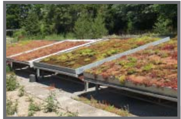
Bild 1: Extensivbegrünung auf flach geneigten Leichtdächern – Gleiche Aufgabenstellung – 6 unterschiedliche Begrünungslösungen: von "...oder gleichwertig" kann nicht die Rede sein...