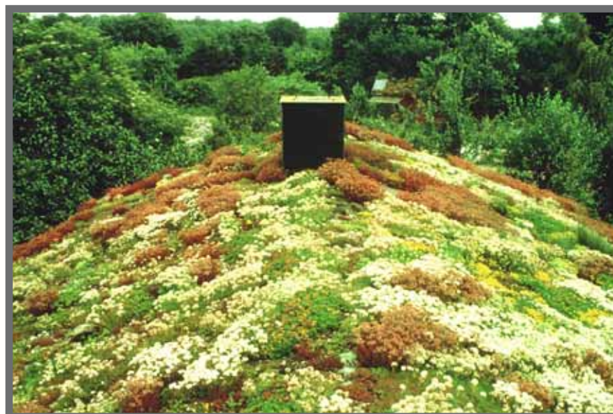
Bild 1: Die reizvolle Wirkung einer Kombination unterschiedlicher Sedum-Arten und ihrer Sorten wird unabhängig von der Blüte, vor allem durch die Farben und Formen des Blattwerks bestimmt.

Von den ursprünglich ausgebrachten Pflanzenarten bleibt, wie Tab. 2 verdeutlicht, zum Ende des Versuches bei fast allen Systemen nur ein Bruchteil übrig. Bedingt durch eine extensive, manchmal gar restriktive Pflegevorgabe durch die Hersteller leiden die Systeme schon nach einer Vegetationsperiode an Artenarmut. Diese lässt sich auch durch eine nachfolgend erfolgte regelmäßige jährliche Düngung nicht mehr ausgleichen. Als widerstandsfähigste Arten erweisen sich Sedum album und Sedum spurium , die zu Versuchsende noch in allen Systemen als bestandsprägende