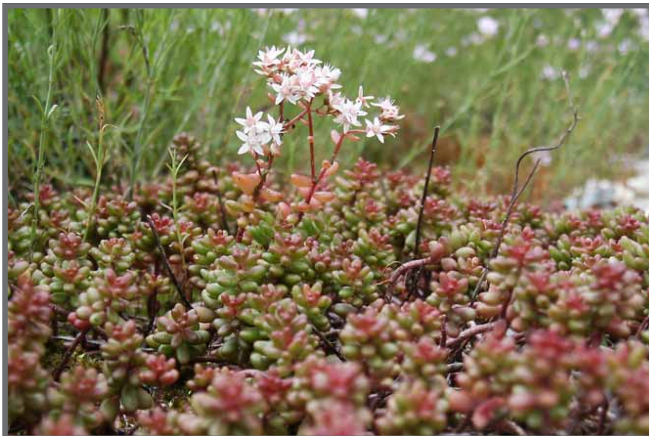
Bild 3: Überlebenskünstler auf dem Gründach: Sedum album (Schneepolster-Sedum), Wuchshöhe: 5 bis 10 cm, Blütezeit: VI-VIII. Verwendung in größeren Gruppen oder flächig; Farbwirkung durch unterschiedliche Blattfärbung.