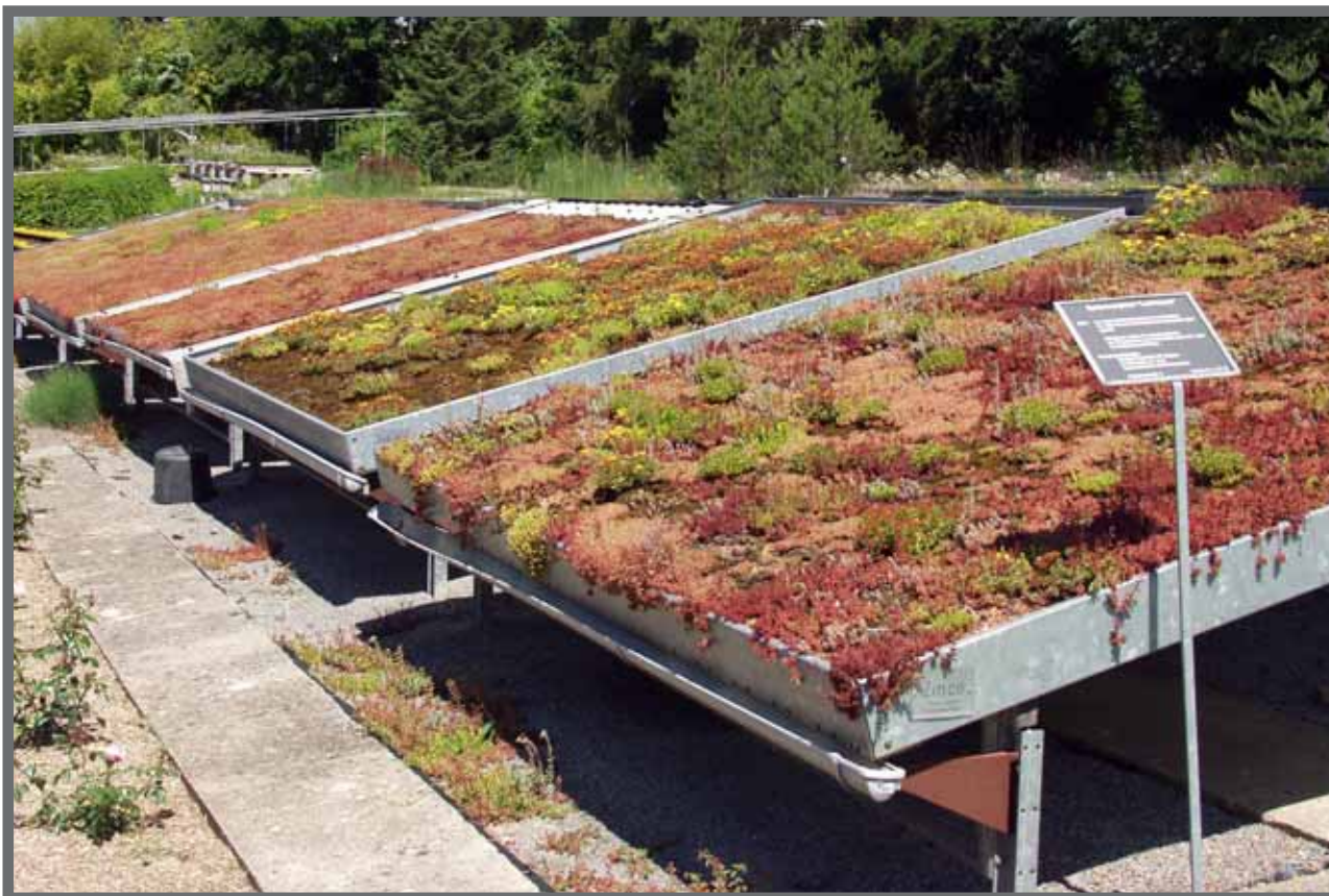
Bild 1: 6 Leichtgründächer im Vergleichstest: Welche Pflanzen überleben bei minimaler Pflege?

Mit Einführung der gesplitteten Abwassergebühr hat sich bei hohem Flächenverbrauch und Versiegelungsgrad die Akzeptanz für entsiegelnde Bauweisen deutlich erhöht. Auch die extensive Dachbegrünung erfährt dadurch in Industrie- und Gewerbegebieten eine stärkere Nachfrage. Durch Retention und Abflussverzögerung zählt sie zusammen mit Einrichtungen zur Speicherung, Nutzung und Versickerung mittlerweile zu den wirtschaftlich interessanten Instrumenten einer zeitgemäßen Regenwasserbewirtschaftung. Beim Wettbewerb um Marktanteile setzen sich erfahrungsgemäß Lösungen durch, mit denen nachhaltige, funktionsgerechte und zielorientierte Dachbegrünungen kostengünstig zu realisieren sind.