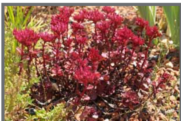
Bild 4: Verlässlicher Begrünungspartner: Sedum spurium hier: 'Erdblut' (Teppich- oder Kaukasus-Sedum), Wuchshöhe: 5 bis 15 cm, Blütezeit: VII-VIII. Verwendung in kleineren Trupps, größeren Kolonien; bildet dichte Teppiche.