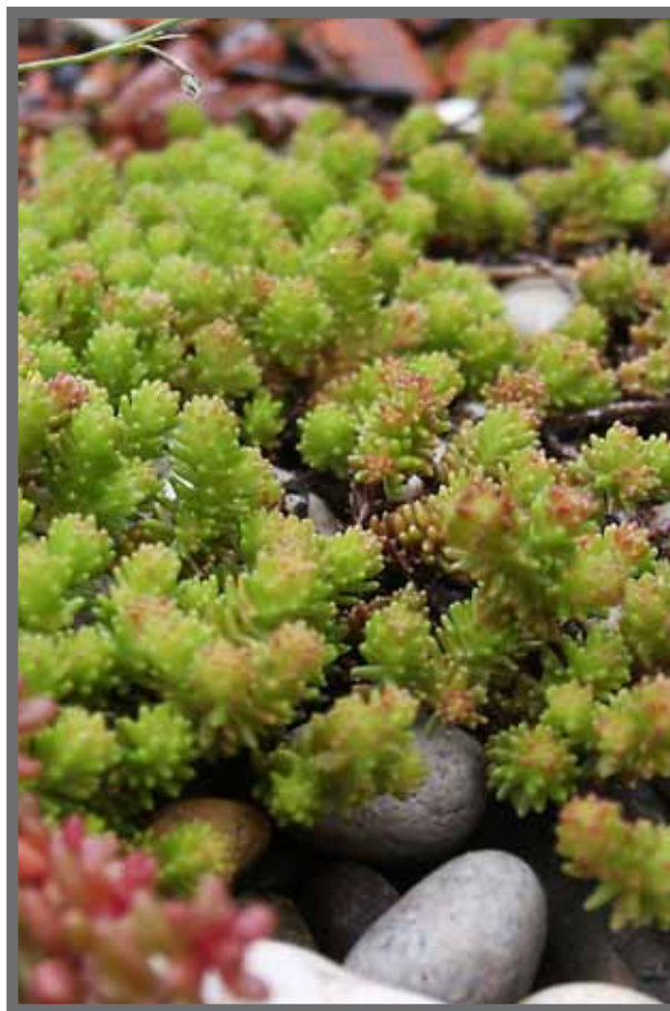
Bild 5: Klein, aber fein: Sedum sexangulare (Goldmoos-Sedum), Wuchshöhe: 5 bis 7 cm, Blütezeit: VI-VII. Verwendung in kleineren Trupps, größeren Kolonien; guter Polsterbildner.

Die Ansprüche an die ästhetische Leistungsfähigkeit sind dabei zwar von untergeordneter Bedeutung; trotzdem kann bei optimierter Pflege mit Leichtdachbegrünungen auch auf Jahre hin, wie die Systeme Zinco und mit Abstrichen Bauder erkennen lassen, eine befriedigende bis gute Optik erzielt werden. Allerdings leiden alle Systeme unter einem fortschreitenden Artenschwund. Selbst widerstandsfähige Sedum-Arten sind den Extrembedingungen bei eingeschränkter Pflege auf Dauer nicht gewachsen. Bei allen Systemen dominiert im Laufe der Entwicklung neben Moos vor allem Sedum album das Erscheinungsbild. Allerdings ist bei den gepflanzten und vor Ort angesäten Systemen ist eine höherer Bestandsgarantie gegeben wie bei den eingesetzten vorkultivierten Matten. Auffallend ist bei allen Systemvarianten der intensive Moosbesatz, der zusammen mit der sich entwickelnden Pflanzendecke für einzelne Varianten bei Wassersättigung auch zum "Lastfall" werden kann. So liegen die Aufbauten von Optigrün im dritten Versuchsjahr bereits knapp über