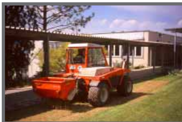
Bild 42: Durch Besanden werden Unebenheiten problemlos ausgeglichen.