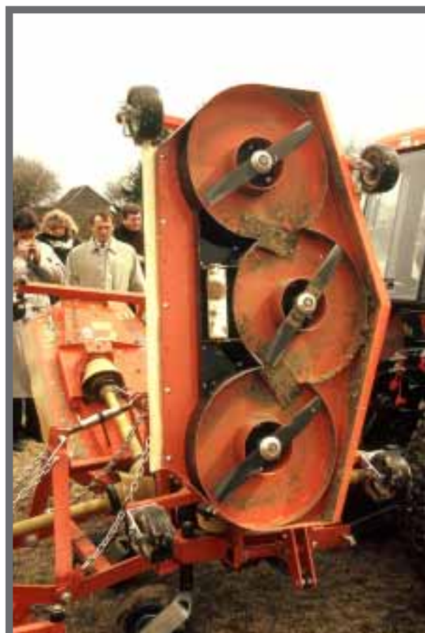
Bild 33: Ein Sichelmäher, hier ein Mulchmäher ohne Auswurf, ist robuster als ein Spindelmäher.