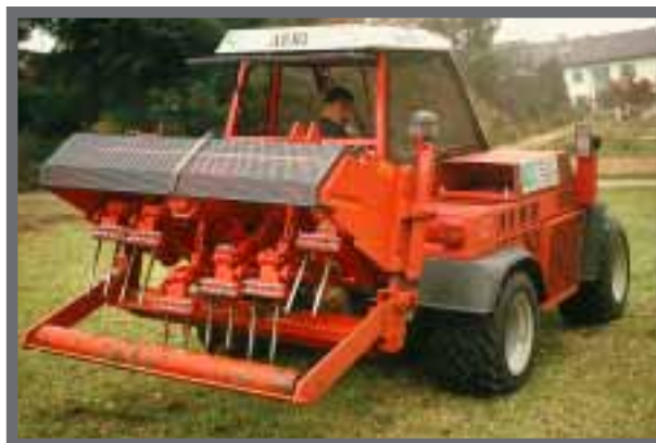
Bild 41: Das Vertidrain-Gerät zum Aerifizieren verdichteter Rasenflächen.