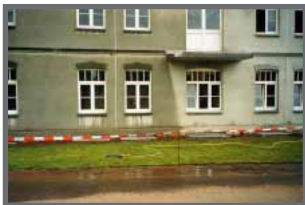
Bild 28: Nach dem Anwalzen ist nur der Rollrasen kräftig anzuwässern.