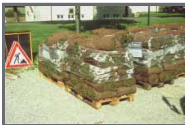
Bild 24: Die Schutzfolie ist auf der Baustelle gleich zu entfernen

Die Bodenvorbereitung erfolgt wie bei der herkömmlichen Ansaat, das heißt, eine ausreichende Grundversorgung mit Nährstoffen ist sicher zu stellen. Ein sauberes, normal erdfeuchtes Planum reicht aus. Der Fertigrasen wird darauf engfügig ohne Kreuzfugen verlegt, so dass keine Lücken verbleiben. Das Planum darf dabei nicht mehr betreten werden.