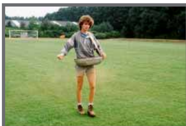
Bild 18: Bei der Düngung per Hand sind zwei gekreuzte Arbeitsgänge nötig.