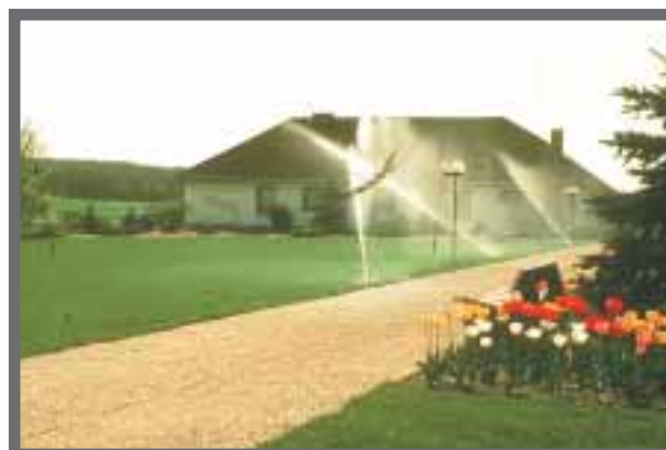
Bild 37: Eine automatische, computergesteuerte Bewässerungsanlage erlaubt eine Beregnung zum optimalen Zeitpunkt.

Ein Intensivrasen benötigt rund 750-850 mm Niederschlag jährlich. Daraus ergibt sich ein regional sehr unterschiedlicher Beregnungsbedarf: während man eine hochwertigen Rasen in Würzburg mit rund 200-250 mm pro Jahr beregnen muss, reichen in München 0-30 mm. Sandige Böden können dabei weniger Wasser speichern als feinkörnigere Tragschichten.