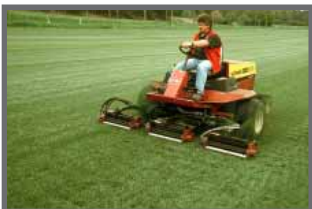
Bild 32: hinterlässt feines Schnittgut, das auch liegen bleiben kann.