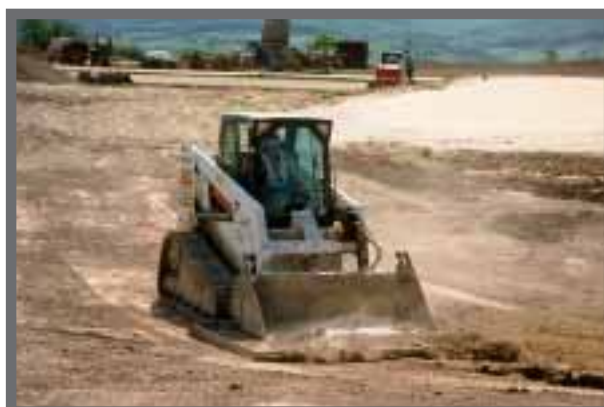
Bild 15: Gerade auf Golfplätzen muss das Feinplanum besonders sorgfältig erfolgen