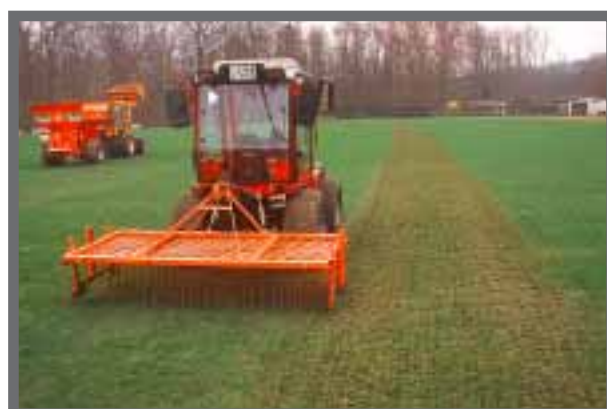
Bild 40: Ein Vertikutierstriegel erlaubt die großflächige und schnelle Beseitigung von Rasenfilz.

Das Senkrechtschneiden (nur bis zur Bodenoberfläche!) dient vor allem der Beseitigung von Rasenfilz (über 1,5cm Stärke), seltener von Moos. Der abgetrocknete Rasen wird vorher auf ca. 2cm geschnitten. Optimaler Zeitpunkt ist vor den Wachstumsschüben im Mai oder Anfang August. Im zeitigen Frühjahr lässt sich Moos gut entfernen.