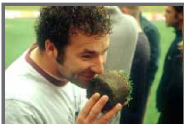
Bild 10: Eine gut durchlüftete, optimale Rasentragschicht stinkt nicht!.

Für eine erfolgreiche Rasenansaat muss die Bodentemperatur mindestens 8°C betragen, optimal sind 14-25°C. Die besten Ergebnisse erzielt man also von Mitte April bis Mitte Juni und von August bis Mitte September. Der Rasen läuft dann innerhalb von 2-3 Wochen auf ( Lolium perenne schon nach 7-9 Tagen). Sobald der Samen gekeimt hat, muss er ständig ausreichend feucht gehalten werden.