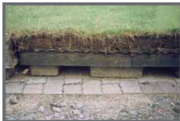
Bild 30: Für hoch beanspruchte Bereiche können Austauschelemente auf Trägerplatten eingesetzt werden.