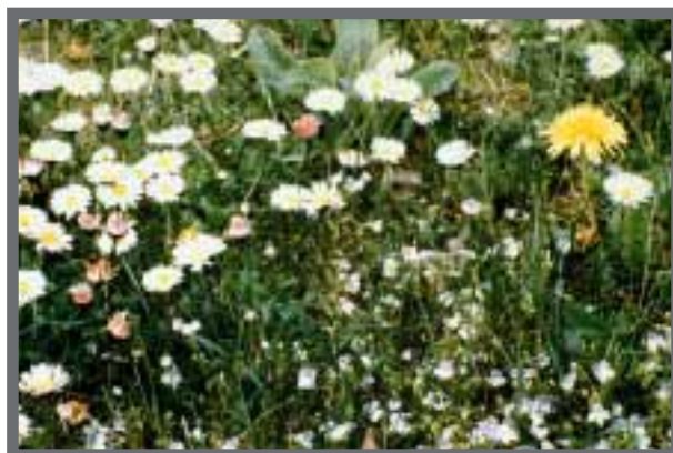
Bild 7: Blumenwiesen stellen hohe Ansprüche an die Pflanzenkenntnis