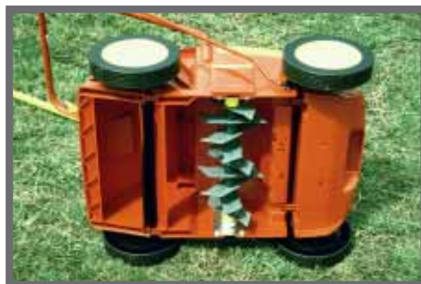
Bild 39: Die Vertikutiermesser sollten nur bis zur Bodenoberfläche reichen.