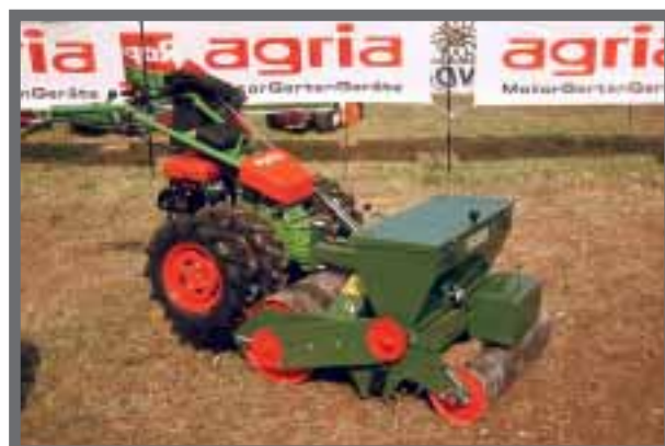
Bild 12: Anbau-Rasenbaumaschine Sembdner RS 80-A an Einachsschlepper.

Im Regelfall werden 25 g/m 2 ausgebracht. Dabei ist grundsätzlich eine Regelsaatgutmischung (RSM) zu empfehlen, z. B. RSM 2.3 Gebrauchsrasen-Spielrasen, die für den jeweiligen Anwendungszweck am erfolgversprechendsten sind. Es lohnt sich nicht, wegen ein paar Cent Ersparnis eine Billigmischung zu verwenden. Bei besonders frühen oder späten Ansaatterminen geht man hoch auf 30 g/m 2 .