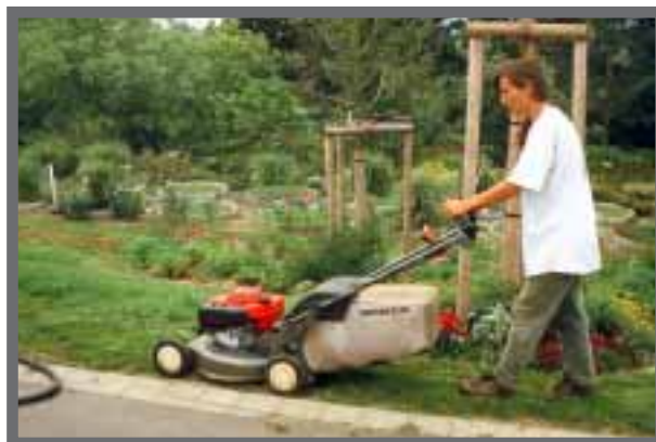
Bild 16: Für die ersten Mähgänge eignet sich ein scharfer Sichelmäher.

Da bei der Bodenvorbereitung bereits eine ausreichende Grundversorgung mit Nährstoffen erfolgt ist, muss im Rahmen der Fertigstellungspflege nur noch Stick-