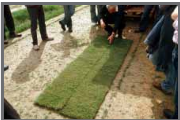
Bild 25: Bei Verzögerungen muss der Fertigrasen ausgerollt werden.

Diese ist viel weniger aufwändig als beim Saattrasen. Der erste Schnitt erfolgt nach 8-10 Tagen. Anfangs stellt man den Mäher etwas höher ein, um eine tiefere Durchwurzelung zu erreichen. Dem selben Zweck dient eine nicht zu häufige, dafür intensive Bewässerung (ca. 15 l/m 2 pro Woche bei fehlenden Niederschlägen). Etwa 2 Wochen nach dem Verlegen bringt der Landschaftsgärtner 5-8 g N/m 2 aus, in der Regel einen schnell wirkenden mineralischen Volldünger, um das Anwachsen zu verbessern. Abnahmefähig ist der Fertigrasen, wenn er an keiner Stelle mehr abgehoben werden kann. Dafür sind im Regelfall laut DIN 18917 4 Schnitte nötig. Nach 3-5 Wochen ist der Rasen dann benutzbar.