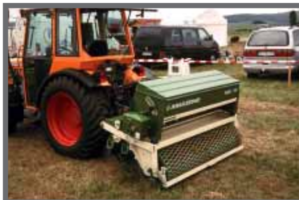
Bild 13: Anbau-Rasensäkombination Amazone GBK 15 mit 1,50m Arbeitsbreite für den großflächigen Einsatz.

Kleine Flächen sät man per Hand in zwei gekreuzten Arbeitsgängen, möglichst bei Windstille. Anschließend ist das Saatgut mit dem Rechen ca. 0,5 cm einzuarbeiten und anzuwalzen. Für größere Flächen verwendet der Landschaftsgärtner besser eine Rasenbaumaschine. Die Angebotspalette reicht dabei von der handgeführten Sämaschine ohne Motor mit 50cm Arbeitsbreite über motorbetriebene Rasenbaumaschinen (60-100cm Arbeitsbreite) bis hin zu breiteren Anbaugeräten aus der Landwirtschaft mit mechanischer oder pneumatischer Saatgutverteilung. Mit diesen Geräten spart man Arbeitsgänge ein und erzielt ein exakteres Ergebnis bei höherer Flächenleistung. Gerade die selbstfahrenden Rasenbaumaschinen sind jedoch nicht ganz billig. Nach der Ansaat wird die Rasenfläche angegossen, und zwar mit einem Schwachregner, um die Oberfläche nicht zu verschlämmen.