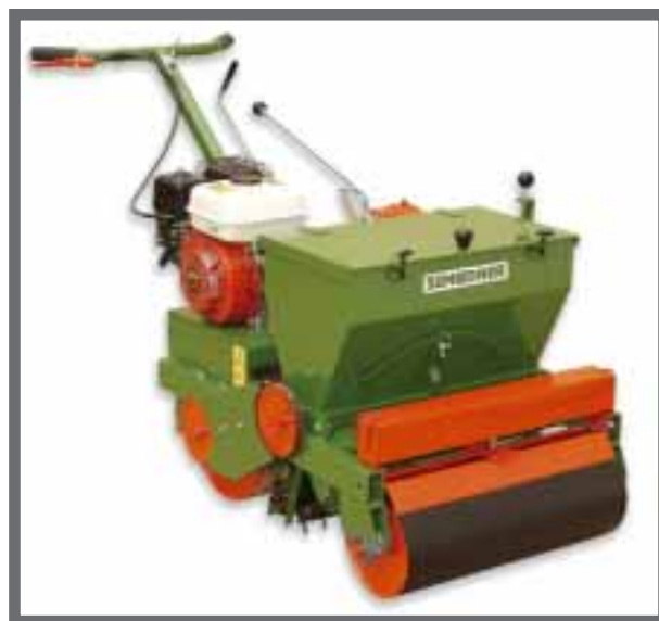
Bild 11: Rasenbaumaschine Sembdner RS 60 N ermöglicht 4 Arbeitsgänge in einem: Vorwalzen - Ansaat - Einigeln - Nachwalzen