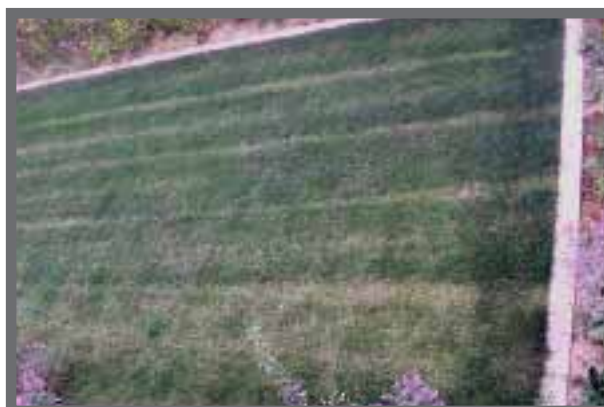
Bild 21: Beim Einsatz eines Kastenstreuers ist auf eine ausreichende Überlappung der Fahrgassen zu achten.