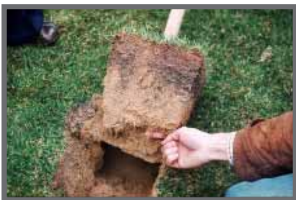
Bild 8: Für belastbare Sportrasen muss die Rasentragsschicht sandig sein.

In der Praxis trifft man allerdings meist auf zu lehmige Böden und muss mehr oder weniger große Mengen an Sand beimischen, um auf die gewünschte Korngrößenverteilung zu kommen. Dazu muss der Boden ausreichend trocken sein, um Gefügeschäden zu vermeiden. In Anpassung an die Durchwurzelungstiefe der Rasengräser beträgt die Stärke der Vegetationstragschicht etwa 15cm (10-20cm laut DIN 18915).