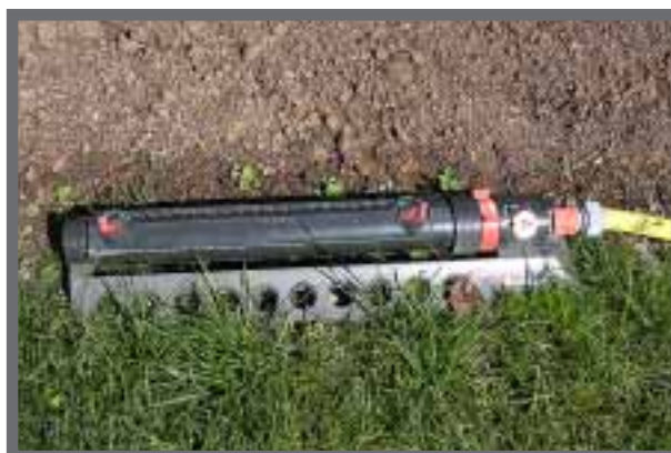
Bild 20: Für die Bewässerung in der Auflaufphase muss der Regner über feine Düsen verfügen.