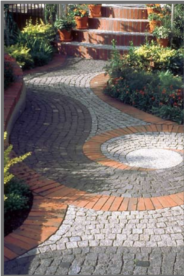
Bild 4: Wer gute Arbeit abliefert, für den spielen vertragsrechtliche Fragen nur eine untergeordnete Rolle.

Nach dem BGH-Urteil vom 24.7.2008 sollte in jedem Fall in den AGB die Verjährungsfrist für Mängelansprüche bei Bauwerken entsprechend der BGB-Regelung auf 5 Jahre festgelegt werden, was für qualitätsbewusste Landschaftsgärtner kein Problem sein dürfte.