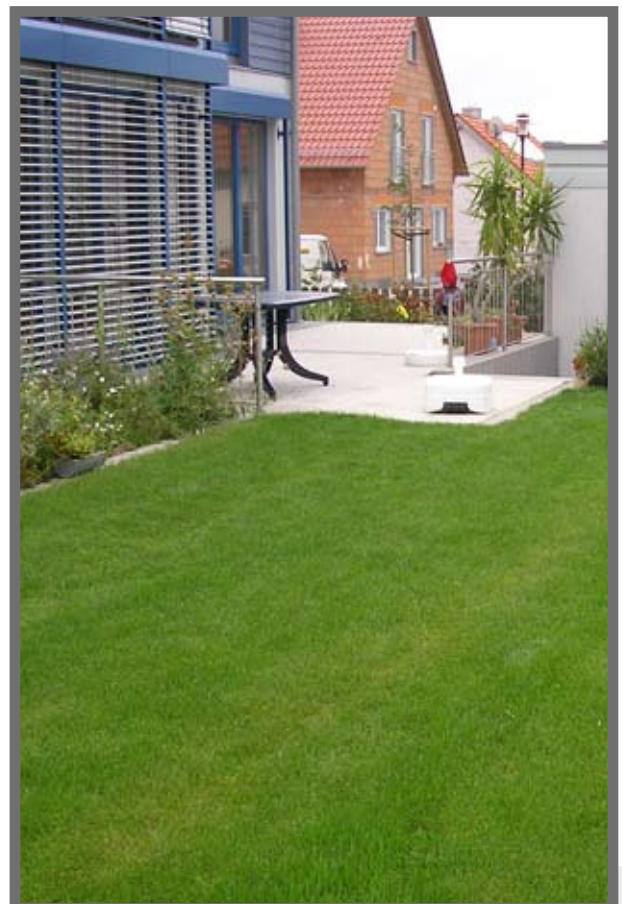
Bild 3: Im Hausgartenbereich wird meist kein Planer eingeschaltet; hier ist der kreative Landschaftsgärtner gefragt.

Sind AGB nach juristischer Prüfung durch ein Gericht unwirksam, tritt an deren Stelle die gesetzliche Regelung (§ 306 BGB).