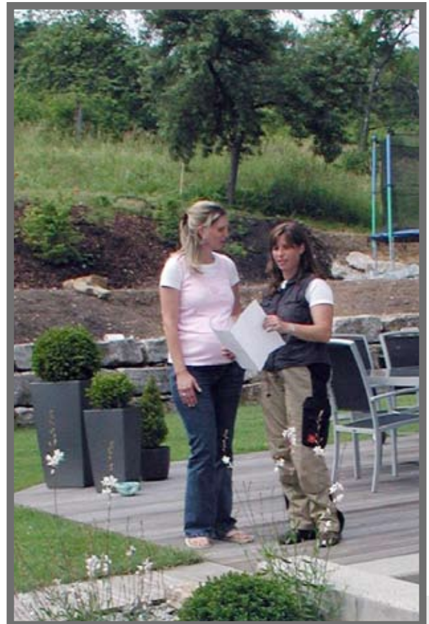
Bild 1: Im Hausgartenbereich besteht ein großer Verhandlungsspielraum. Genaue Absprachen mit dem Kunden vor und während der Gartengestaltung sind entscheidend.

Berücksichtigt man zudem die Schuldrechtsreform von 2002 mit entscheidenden Verbesserungen des BGB-Werkvertragsrechts aus Auftragnehmersicht (DEGENBECK 2003), sei die Frage erlaubt, ob die VOB auch im Privatgartensektor und gerade bei kleineren Aufträgen eine geeignete Vertragsgrundlage ist oder ob nicht auch ein BGB-Werkvertrag eine vernünftige Alternative sein könnte. Gerade beim BGB-Werkvertrag spielen die Allgemeinen Geschäftsbedingungen (AGB) des Landschaftsgärtners eine wichtige Rolle, wie nachfolgend dargelegt wird.