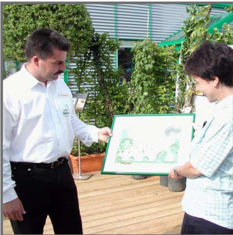
Bild 5: Ein gutes Verhältnis zum Kunden hat oberste Priorität; die Aushändigung des Entwurfes zum Abschluss ist sicher ein gutes Marketing-Instrument.

Wirth, A., Sienz, C., Englert, K. u.a. (2002): Verträge am Bau nach der Schuldrechtsreform – Werner Verlag, Düsseldorf, 516 S.