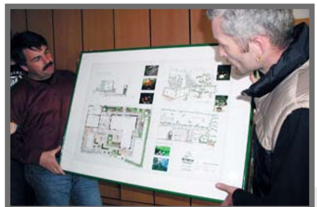
Bild 2: Gute Planung kann nicht kostenlos sein! Die AGB müssen Aussagen zum Schutz vor „Ideenklau“ beinhalten, der aber nie ganz auszuschließen ist.

Seit 1926 wird sie vom Deutschen Vergabe- und Vertragsausschuss (DVA) laufend weiterentwickelt. Im DVA sind öffentliche Auftraggeber und Auftragnehmervertreter paritätisch vertreten. Somit ging man bisher von einer ausgewogenen Berücksichtigung der Interessen von AG und AN aus (KORBION & V.WIETERSHEIM 2006). Dies ist deshalb wichtig, weil die VOB/B Regelungen enthält, die für sich genommen gesetzeswidrig wären. Ein Paradebeispiel hierfür ist die Verkürzung der Verjährungsfrist für Mängelansprüche bei Bauwerken auf vier Jahre. Deswegen durfte die VOB/B nur unverändert vereinbart werden, abgesehen von wenigen Punkten, wo eine abweichende Festlegung in der VOB/B ausdrücklich zugelassen wird (z.B. die Abrechnung nach Einheitspreisen und tatsächlichen Mengen). Es durfte keine Klausel gestrichen werden. Umgekehrt ist eine Aufnahme von VOB-Regelungen in BGB-Werkverträge durchaus erlaubt, auch ganzer Paragraphen.