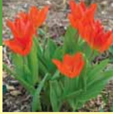
Tulipa praestans 'Füsilier'