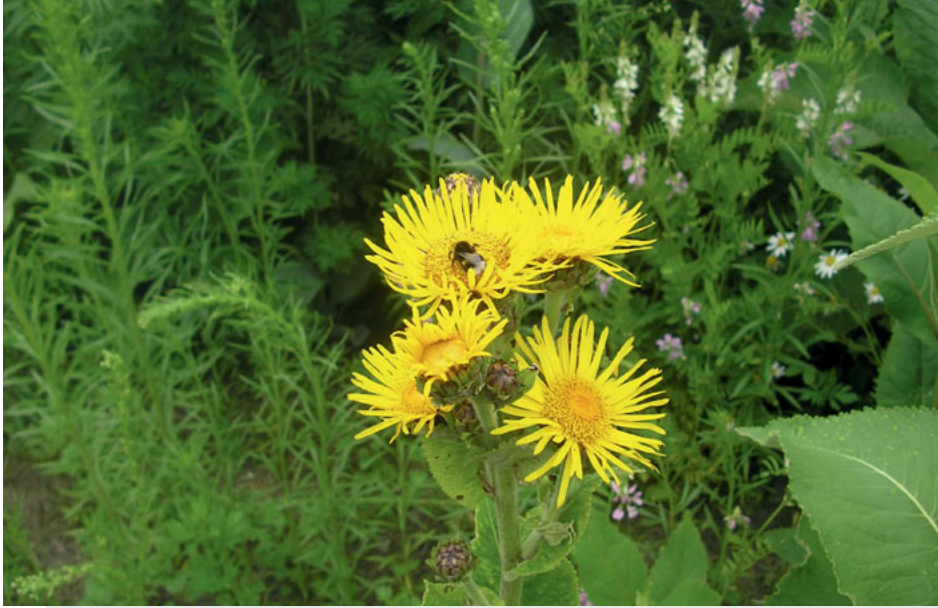
Bild 4: Um Blütentracht für Honigbienen und andere Insekten „im Sommerloch“ anzubieten, werden fremdländische Arten mit später Blüte getestet, hier Inula helenium .

Der Biomassertrag wird hauptsächlich von wenigen Pflanzenarten bestimmt, auf welche der Erntetermin abgestimmt wird. Ergänzt werden diese durch weitere Arten, welche für die Blütentracht und die Attraktivität für Wildtiere verantwortlich sind.