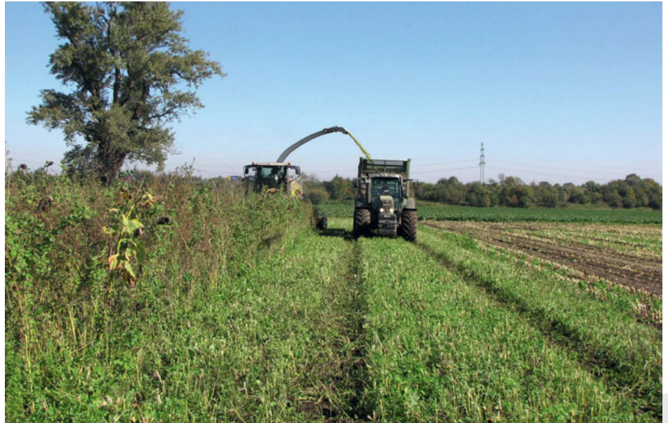
Bild 5: Bei der Ernte mit einem reihenunabhängigen Häcksler ergaben sich in den Praxisversuchen nur vereinzelt Probleme: die Anbauempfehlungen werden laufend optimiert.

Bei allen untersuchten Tierartengruppen konnte gezeigt werden, dass die Testflächen eine höhere Arten- und Individuenzahl aufwiesen als benachbarte Maisflächen. Die Anzahl gefährdeter Arten war ebenfalls deutlich höher. Honigbienen und andere Blütenbesucher nutzten die Testflächen als wichtige Nektar- und Pollenquelle bis in den Spätsommer, wenn im Umfeld fast nichts mehr blüht. Die Insekten locken Vögel und Fledermäuse an; so wurden im Umfeld der Versuchsflächen schon im ersten Untersuchungsjahr 30 Vogelarten (davon 15 gefährdete Arten der Roten Liste) sowie bis zu 9 Fledermausarten gezählt.