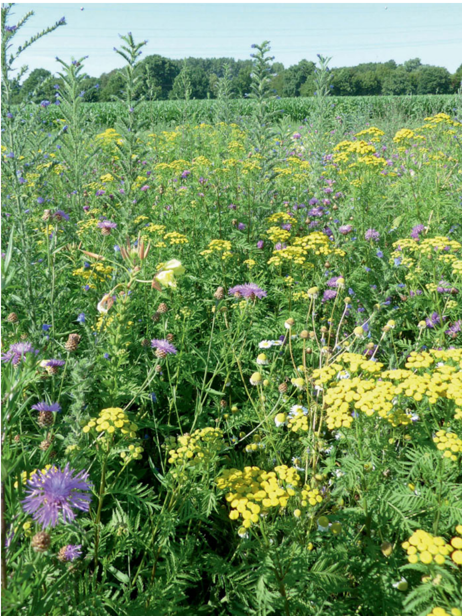
Bild 2: Die Wildpflanzenmischung (heimisch, hier im 2. Standjahr) entwickelt sich je nach Standort unterschiedlich; hier sind Rainfarn, Flockenblume und Natternkopf bestandsbildend.

Seit 2011 fördert auch das Bayerische Staatsministerium für Ernährung, Landwirtschaft und Forsten (BayStMELF) die