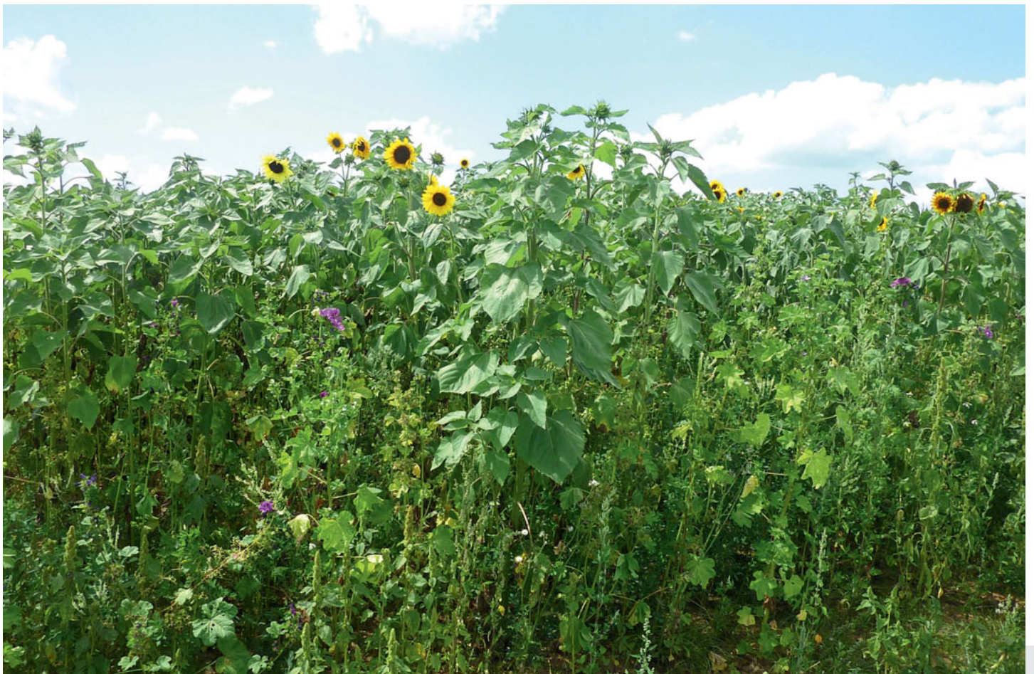
Bild 1: Die Wildpflanzenmischung (heimisch) im 1. Standjahr ist geprägt von Malven und Sonnenblumen.

Darunter leiden die Wildtiere der Agrarlandschaft wie z.B. Feldhase und Rebhuhn ebenso wie zahlreiche andere Vogelarten und Insekten. Ein besonderes Problem für die Honigbiene ist der Mangel an Blütentracht im Sommer. Schließlich sind großflächige Monokulturen dem Image der Landwirtschaft in der Bevölkerung eher abträglich.