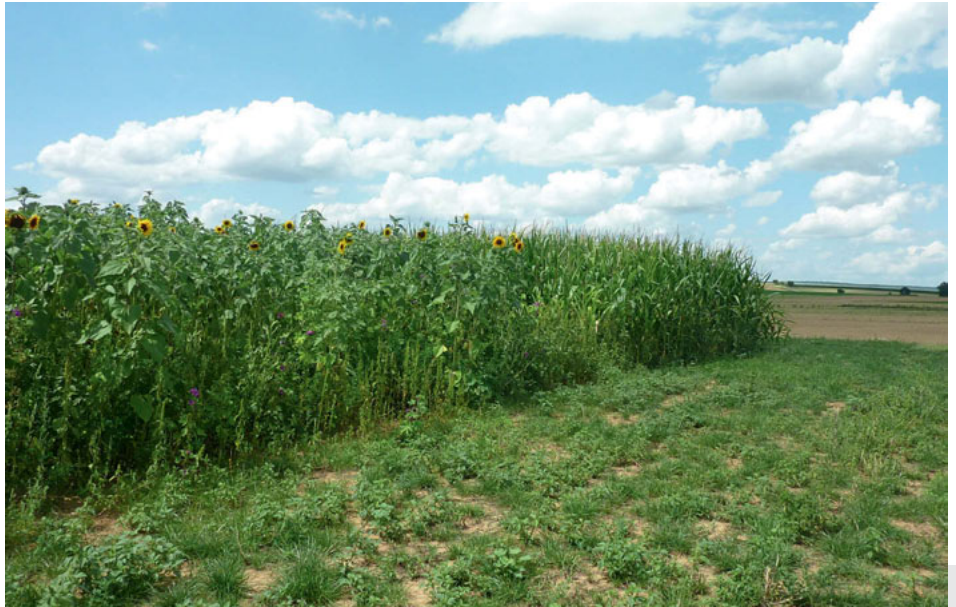
Bild 3: Parzellenversuch in Schwarzenau (Lkr. Kitzingen); neben der Wildpflanzenmischung wird zum Vergleich Mais angesät. Auch die Maisuntersaat wird getestet.

Ziel ist es dabei nicht, eine ökonomisch gleichwertige Alternative zum Mais zu entwickeln. Es geht vielmehr darum, für verschiedene Standorte Ergänzungen zu den Hauptenergiekulturen anbieten zu können, also um einen Kompromiss zwischen Ökonomie und Ökologie bei der Energiepflanzenproduktion für die Biogasnutzung.