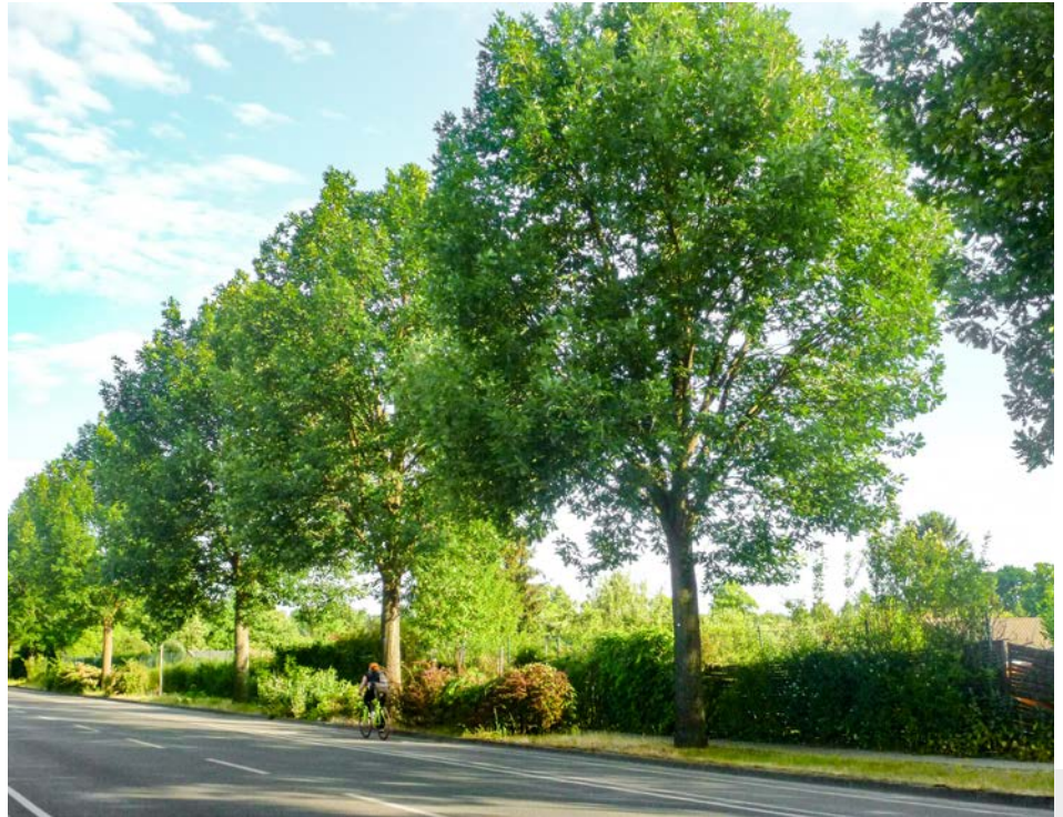
Bild 4: Quercus frainetto , hier in Berlin, ist hitze- und trockenheitsverträglich.