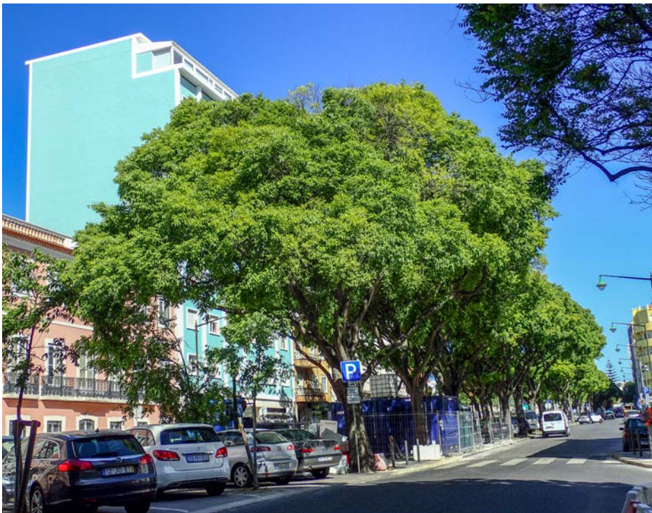
Bild 8: Celtis australis ist in Lissabon ein häufig gepflanzter Straßenbaum.

Für den Lebensbereich 3.1. (Auswahl): Carya glabra , Corylus americana , Gymnocladus dioica .