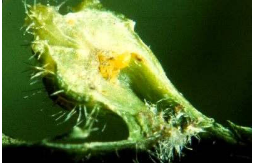
Abb. 2: Blattreblausgalle, die nach außen hin durch reusenartig angeordnete Blatthaare abgeschlossen ist

Auf Blättern mit normal ausgebildeten Blattgallen, deren Öffnungen blattoberseits mit reusenartigen, zu einander stehenden Blatthaaren abgeschlossen sind (vgl. Abb. 2), sind in der Regel nur milbenartige oder sonstige sehr kleine Reblausfeinde zu finden.