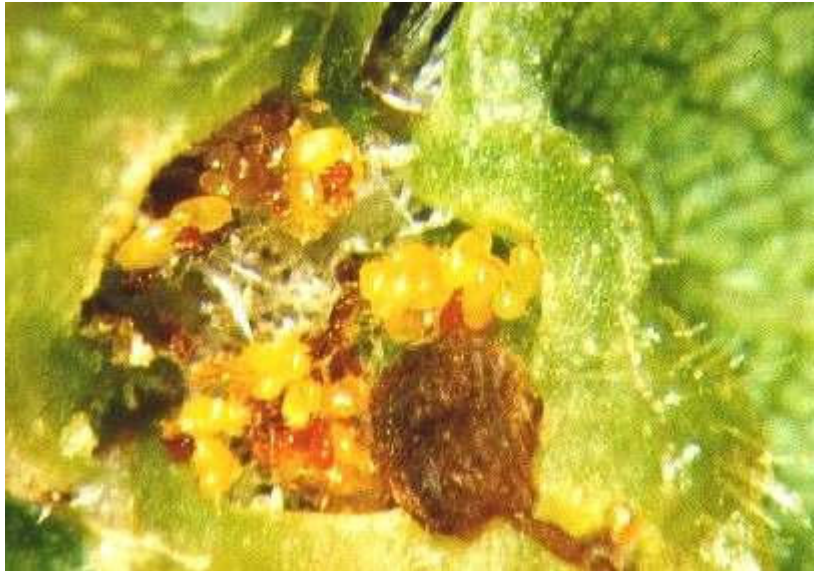
Abb. 12: Verfärbte und verformte Eier in einer Blattgalle

Ab dem Frühsommer finden sich in den Blattreblausgallen inmitten der üblicherweise gelben, auffällig rötlich bis bräunlich verfärbte Eier (vgl. Abb. links ), die immer wieder auch von scheinbar eingeschrumpelten Eiern oder dunkelbraun verfärbten Eihüllen be-