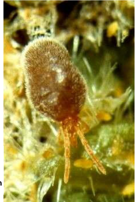
Abb. 4: Sammetmilbe ( Trombidium holosericeum ) inmitten von jungen Blattrebläusen

Diese weitverbreitete, bis zu 4 mm große, recht lebhafte und rot gefärbte Milbe (vgl. Abb. 4) lebt im Allgemeinen räuberisch im Boden. Wir konnten sie gehäuft an Wurzeln mit Wurzelrebläusen, vor allem aber in großer Zahl auf Rebblättern, Rebläuse aussaugend, finden, wobei sie sich, den Rebläusen folgend, bis in das Innere der Blattgallen zwängte.