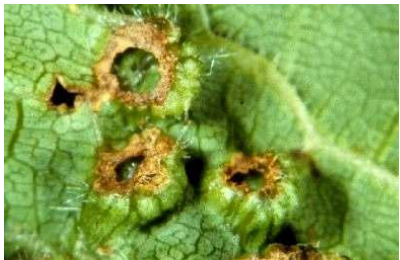
Abb.13: Durch einen Pflanzenfresser geöffnete Blattgallen.

Fraßschäden an Blattgallen sind in unterschiedlichem Ausmaß immer wieder zu beobachten. Meist sind diese Fraßschäden lokal gehäuft an mehreren benachbarten Blattgallen zu finden. Der oder die Verursacher sind derzeit nicht bekannt. Möglicherweise sind es, wie oben schon nach STELLWAAG zitiert, größere Pflanzenfresser, wie z. B. Heuschrecken, die die saftigen Blattgallen befraßen. Da in den angefrissenen Gallen so gut wie keine Blattreblausstadien mehr zu finden waren, ist davon auszugehen, dass die Gallen nach dem Öffnen von Räubern ausgeräumt wurden (s. Abb.13).