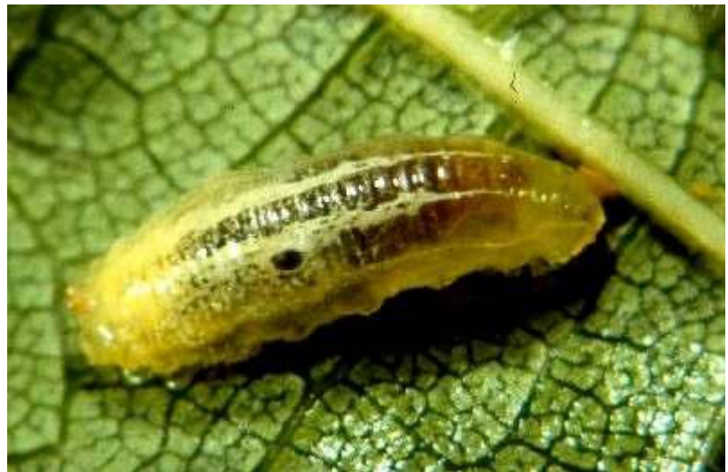
Abb. 8: Schwebfliegenlarve