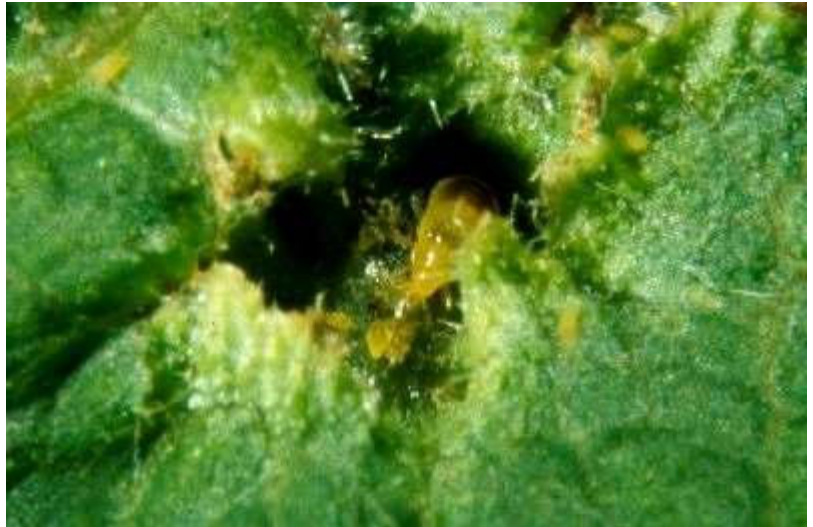
Abb. 10: Larve einer räuberischen Blütenwanze beim Aussaugen einer Blattrebläuse

Die Blütenwanzen sind recht aktive und unerschrockene Räuber. Die Larven wie auch die Adulten der weitverbreiteten Art Anthocoris nemorum L. (max. 4 mm) sind relativ häufig auf den Rebblättern mit Blattrebläusen zu finden, wobei sie sich, abhängig von der Anzahl der Beutetiere, beim Aussaugen der Blattrebläuse mehr oder weniger Zeit lassen (vgl. Abb. 10).