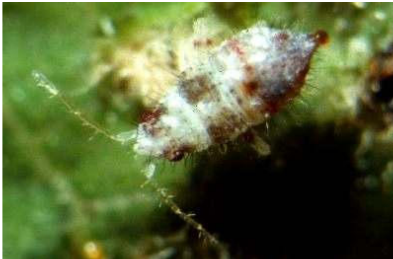
Abb. 11: Larve einer Weichwanze ( Miridae )

Die Weichwanzen sind mittelgroß oftmals auffällig bunt gefärbt und leben je nach Art sowohl von Pflanzensäften als auch von kleinen Tieren, insbesondere Blattläusen. Die