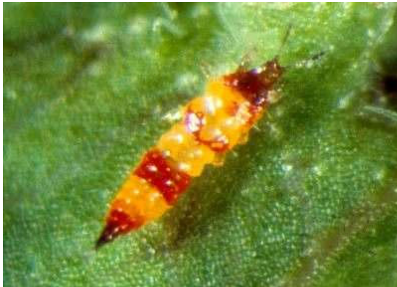
Abb. 6: Auffällig gelblich-rot gestreifter Thrips mit vermutlich räuberischer Lebensweise

Unabhängig von dem weitverbreiteten Rebenthrips ( Drepanothrips reuteri Uz.), konnten wir auf Rebblättern mit Blattraubebefall regelmäßig den in der Abb. 6 gezeigten, gelblich-rot gestreiften, derzeit nicht taxonomisch zugeordneten Thrips beobachten. Er hielt sich auf der Blattoberfläche stets in der Nähe oder inmitten von Jungläusen auf, oder aber stöberte in den Blattgallen. Auch wenn er bislang noch nicht direkt beim Verzehr von Blattraubestadien beobachtet werden konnte, so schließen wir in Bezug auf die Blatträuber eine, für einige Thripsgruppen durchaus übliche, räuberische Lebensweise nicht aus.