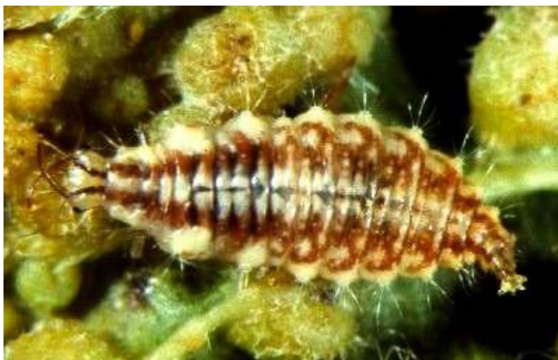
Abb. 9: Florfliegenlarve