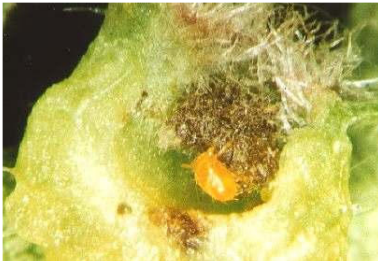
Abb. 5: Orange Milbe unbekannter Art in einer Blattreblausgalle