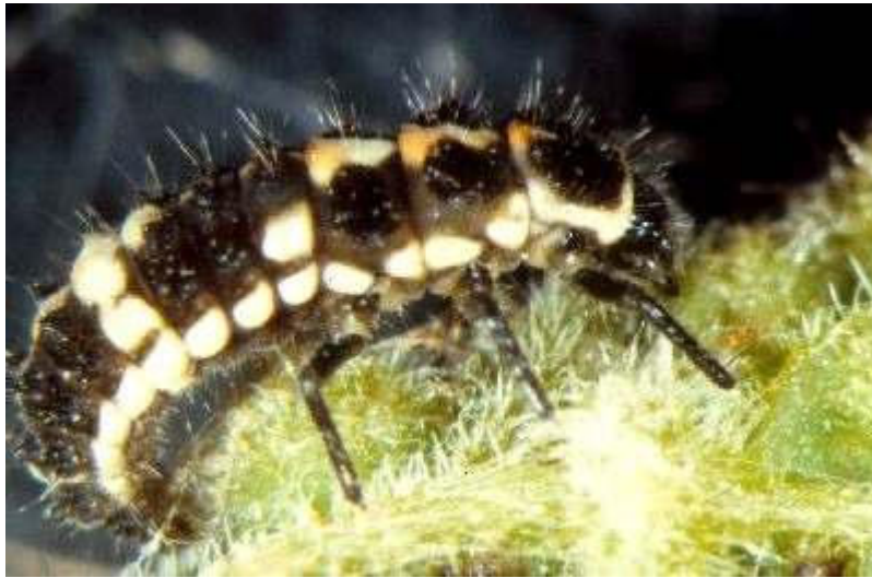
Abb. 7: Marienkäferlarve Aufnahme: Herrmann

Die Larven von Marienkäfer-, Schwebfliegen- und Florfliegenarten gelten als die „klassischen“ Blattlausfeinde und sind weitverbreitet. Auch auf Blättern mit Blattreblausbefall sind die diversen, offensichtlich räuberisch von Blattrebläusen lebenden Larven aus diesen drei Insektenfamilien recht häufig anzutreffen (vgl. Abb. 7-9). Diese Räuber können ihrer Beute bis in die Blattgallen folgen und die Gallen regelrecht leer fressen.