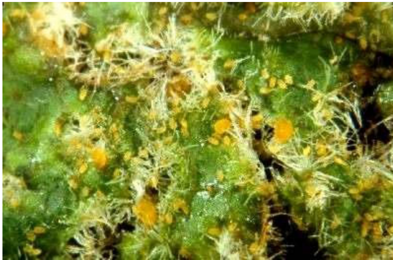
Abb. 3: In Folge massiven Reblausbefalls sind die Gallen nur unvollständig abgeschlossen, und zahlreiche Mutterläuse befinden sich mit ihren Eigelegenen und den Jungläusen mehr oder weniger frei und ungeschützt auf der Blattoberseite