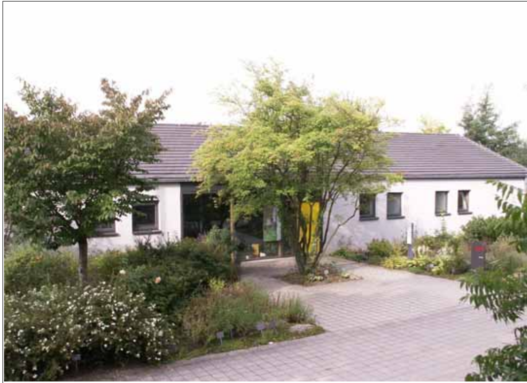
Abbildung: Das Fachzentrum Bienen in Veitshöchheim