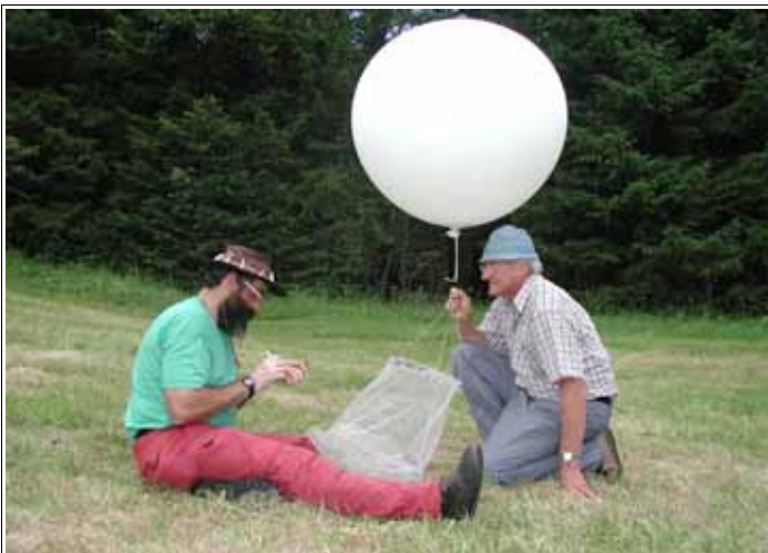
Abbildung: Die Drohnen werden herausgefangen und farblich markiert, dann dürfen sie wieder fliegen.

In einer zweiten Untersuchung wurden einige Drohnensammelplätze mit Ballon ermittelt und auf einem der Plätze die Drohnen farblich markiert und über die Wiederfangrate eine Abschätzung der Drohnendichte vorgenommen. Im vorliegenden Fall dürfte die Zahl der Drohnen bei etwa 16000 gelegen haben.