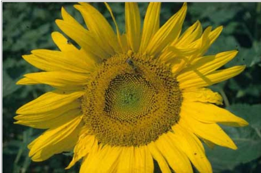
Abbildung: Sonnenblumenanbau hat in den letzten Jahren deutlich zugenommen.

In Zusammenarbeit mit dem Bieneninstitut Kirchhain wurde die Attraktivität und Bienenverträglichkeit der Sonnenblumen-Tracht untersucht. Insgesamt zwölf Bienenvölker stellten wir zu Beginn der Sonnenblumenblüte unmittelbar an einen 3,5 ha großen Sonnenblumenschlag. Die Hälfte der Völker hatte uneingeschränkten Zugang zur Sonnenblumentracht, während die andere Hälfte mit Pollenfallen versehen war und eingetragener Sonnenblumenpollen entnommen wurde. Als Kontrollgruppe dienten weitere sechs Völker, denen weder Sonnenblume noch eine andere Massentracht zur Verfügung stand. Die Völker mit Zugang zur Sonnenblume überwinterten auf den Vorräten aus der Sonnenblumentracht, die Kontrollgruppe erhielt Zuckerlösung als Winterfutter.