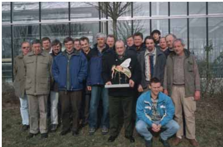
Abbildung: Teilnehmer eines Seuchenkurses 2006

Zum richtigen Verständnis über den Beratungsumfang ist hier hervorzuheben, dass diese Angaben nicht die Beratungstätigkeit der Fachberater von Oberbayern und von Oberfranken enthalten, da diese organisatorisch nicht an der Landesanstalt angegliedert sind. Außerdem ist die Stelle des Fachberaters in der Oberpfalz nicht mehr besetzt, so dass – trotz Vertretung – das Beratungsangebot hier zumindest eingeschränkt ist!