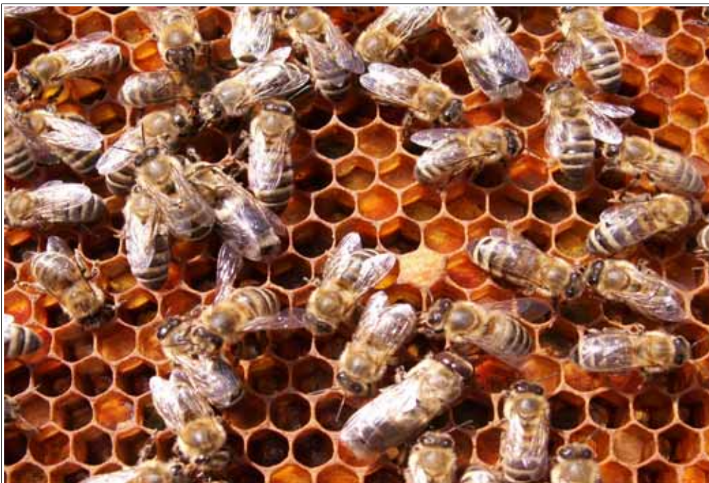
Abbildung: Gute Pollenvorräte sind die Grundlage für gut genährte Bienen.