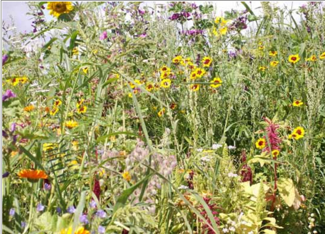
Abbildung: Veitshöchheimer Bienenweide: eine einzige Blütenpracht!

Kurz nach den Eisheiligen wurde auf dem Gelände der Landesanstalt eine größere Fläche mit der Saatgutmischung „Veitshöchheimer Bienenweide“ angesät. Die Fläche wuchs in großem Blütenreichtum zu einer wertvollen Nektar- und Pollenquelle für Bienen und andere blütenbesuchende Insekten heran und entwickelte sich für zahlreiche Besucher, auch Nicht-Imker, zu einem viel beachteten Beispiel für wertvolle Brachlandbegrünung. Das Bayerische Fernsehen stellte die Saatgutmischung in einer Querbeet-Sendung vor.