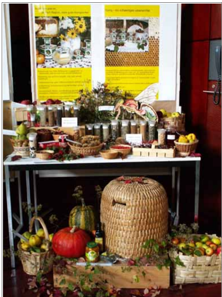
Abbildung: Der Streuobsttag bietet die Möglichkeit, mit vielen Früchten die Bestäubungsleistung der Bienen herauszustellen.

Beim Tag der Offenen Tür der Landesanstalt Anfang Juli in Veitshöchheim konnten sich mehrere Tausend Besucher über Bienen und Imkerei informieren, beim Streuobsttag im Oktober stand dann der ökologische Wert der Bienenhaltung im Vordergrund. Ähnliche Veranstaltungen wurden von den Fachberatern an verschiedenen Standorten in Bayern unterstützt. Anlässlich der Grenzüberschreitenden Gartenschau in Marktredwitz und Eger 2006 betreuten wir für eine Woche den Ausstellungsstand des Staatsministeriums für Landwirtschaft und Forsten in Marktredwitz und informierten insbesondere über den Wert der Honigbiene als Bestäuberinsekt. Erfreulich ist, dass die Imkervereine aus Bayern verstärkt das neue Angebot des Fachzentrum Bienen – nach dem Umzug von Erlangen nach Veitshöchheim annehmen. Insgesamt 16 Vereine hatten sich zu Führungen angemeldet und sahen sich am neuen Standort um, in der gepflegten Imkerei ebenso wie in den schönen und reichhaltigen gärtnerischen Anlagen der Landesanstalt.