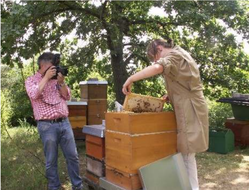
Abb. 14: Fototermin für unsere Auszubildende zur Tierwirtin, Fachrichtung Imkerei.

Für eine Fotoserie zum Tierwirtschaftsmeister, Teilbereich Bienen, der Bundesagentur für Arbeit wurden mit dem Fotostudio Jäckel aus Untersiemau Bilder aufgenommen. Die Bilder sollen die theoretischen Informationen zu den jeweiligen Berufen illustrieren und die Berufe anschaulicher darstellen. Sie finden in den Informationssystemen der Bundesagentur für Arbeit (z.B. BERUFENET) Verwendung.