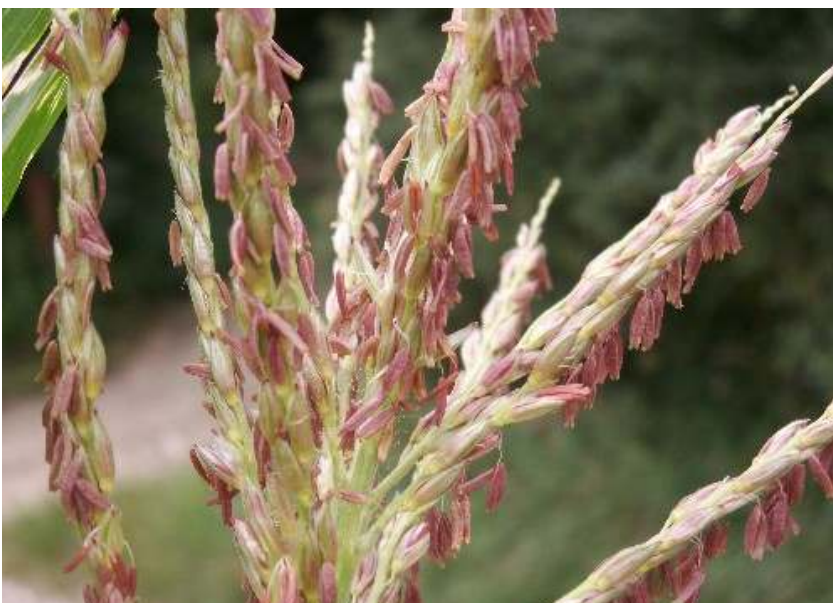
Abb. 8: Mais als Windblütler produziert in seinen Staubbeutel eine große Menge Blütenstaub.