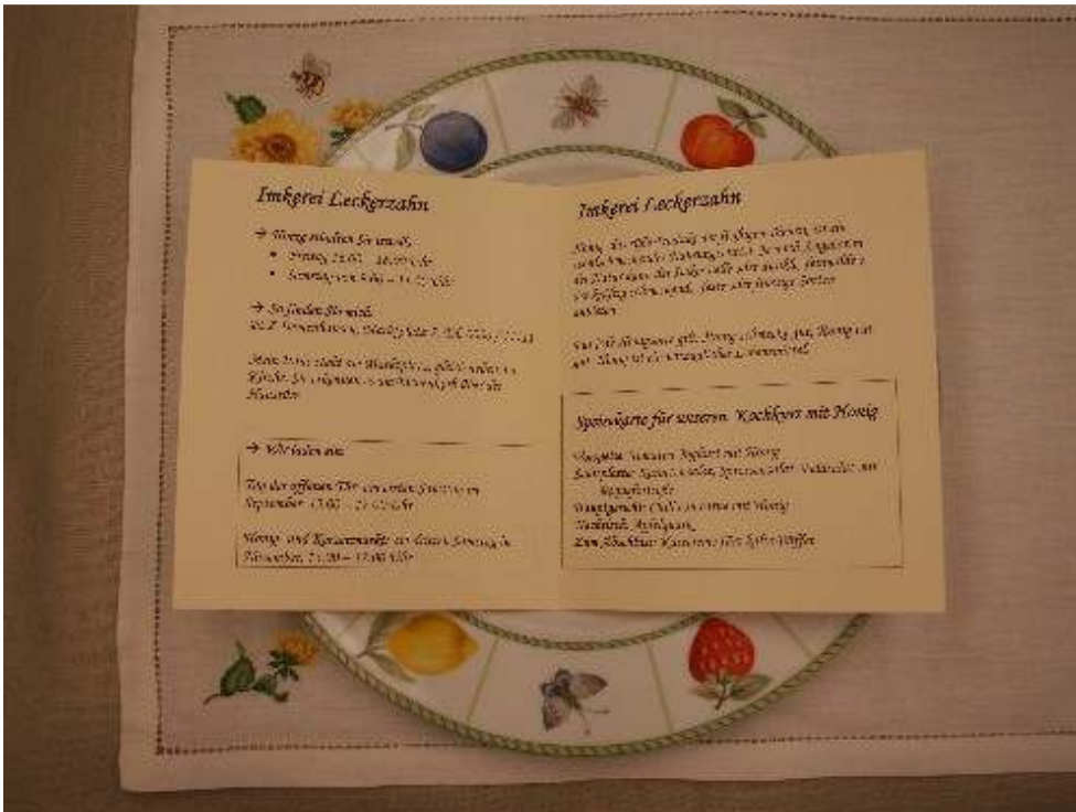
Abb. 12: Die Speisekarte der Imkerei Leckerzahn gehört zu jedem Honigkochkurs.