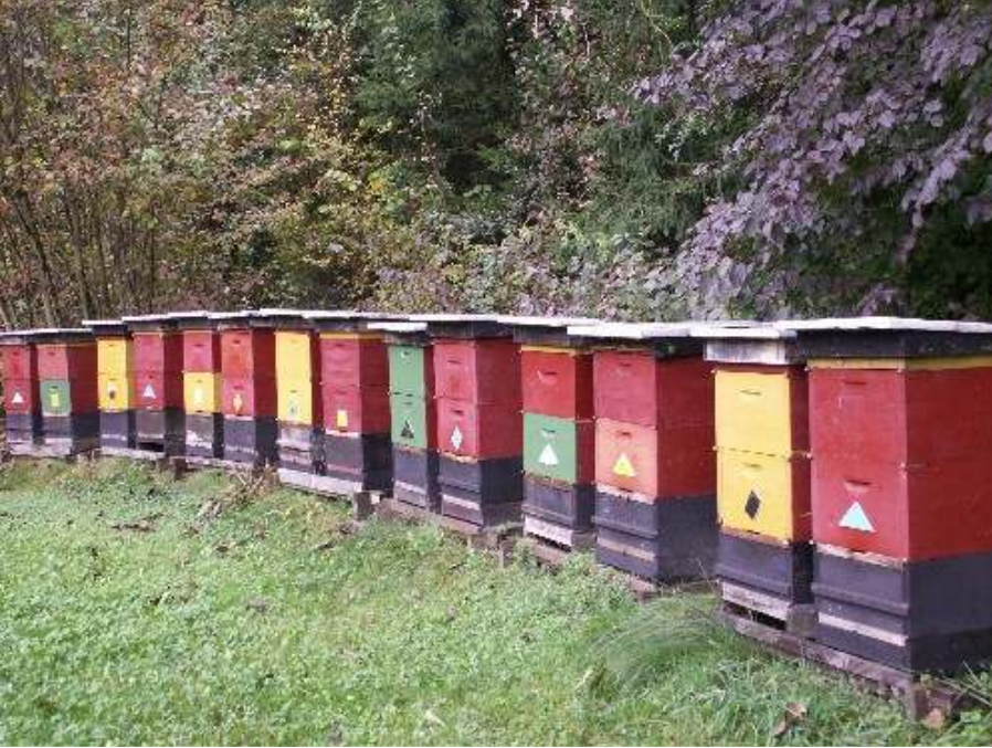
Abb. 11: Leistungsprüfung: einheitliche Völkerführung ist das Grundprinzip der vergleichenden Untersuchung!