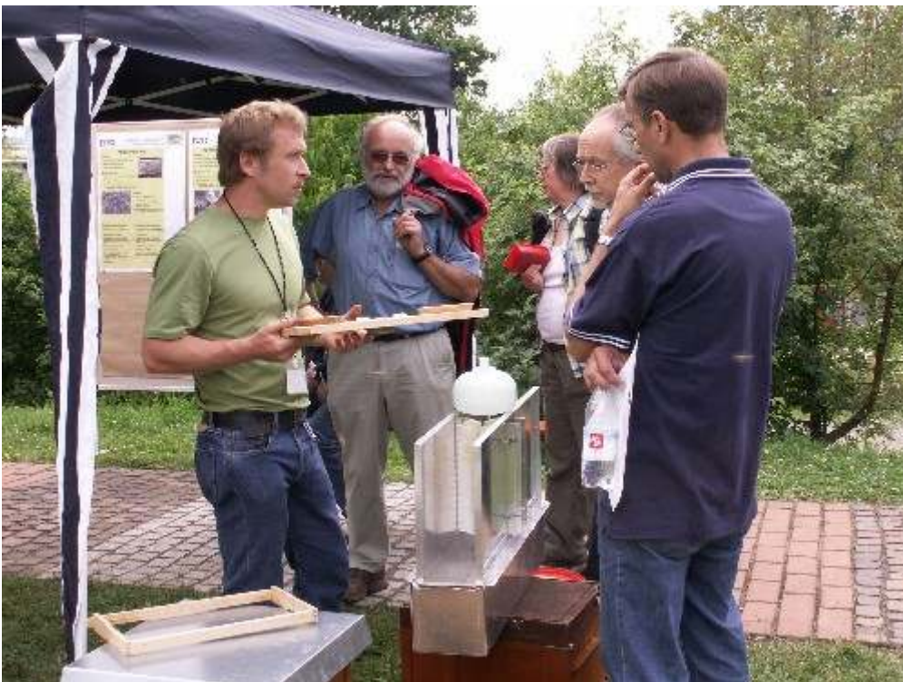
Abb. 2: Fachsimpeleien beim Veitshöchheimer Imkertag

Zum Höhepunkt im Veitshöchheimer Bienenjahr hat sich ganz klar der Veitshöchheimer Imkertag entwickelt. Bei schönstem Bienenwetter konnten wir etwa 600 Imker aus nah und fern begrüßen. Fachvorträge (beim Varroavortrag in der Aula gab es nur noch Stehplätze!), mehreren Stationen mit praktischen Vorführungen insbesondere zur Ablegerbildung, Ausstellungen zu Bienenweide, Bienenprodukten und Marketing boten viele interessante Informationen für die angereisten Gäste. Einen besonderen Ansturm erlebte die wertvolle wissenschaftliche Lehksammlung des Fachzentrums, die mit vielen Besonderheiten von Bienenmodellen und Schleudern über Honigsammlung, Körbe und Kästen bis zu Karbolpfeife und Begattungskästchen Einblicke in den Erfindergeist der Imker, aber auch in historische Entwicklungsreihen gibt, deren Weiterentwicklung bei nicht wenigen Gegenständen wir heute noch nutzen.