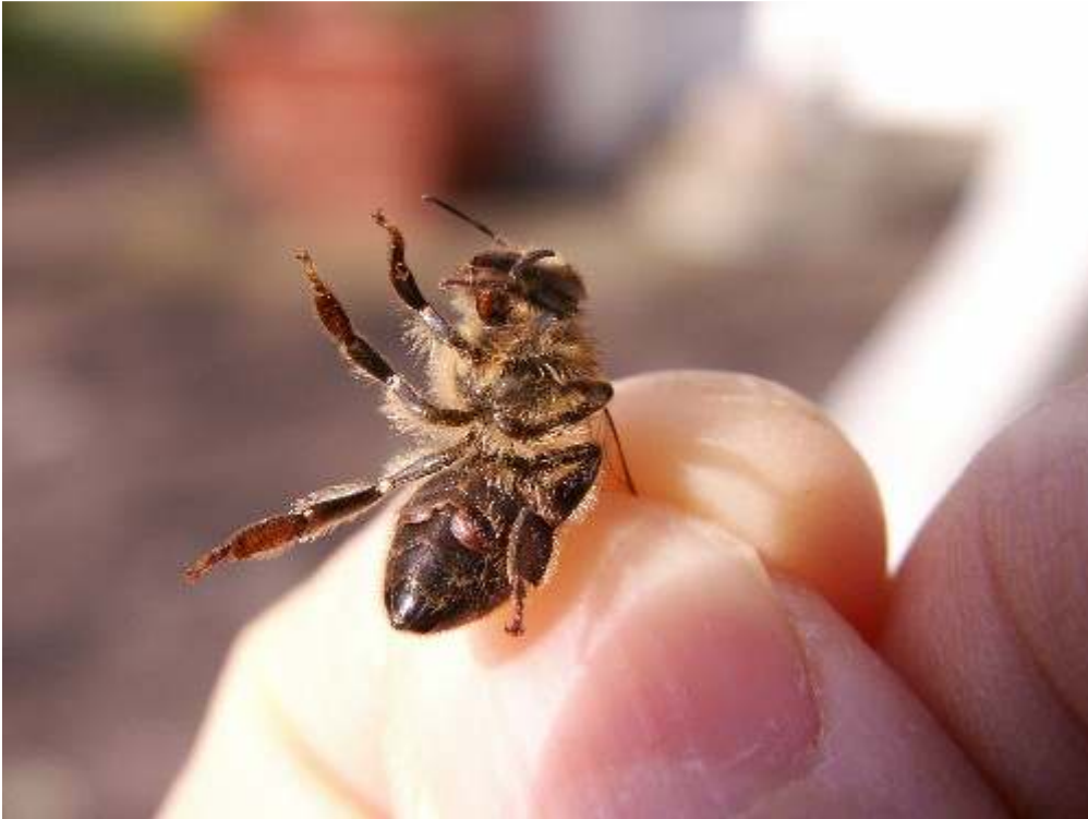
Abb. 10: Gequälte Bienen: zwei Varroamilben sitzen in den Bauchtaschen einer Arbeiterin.