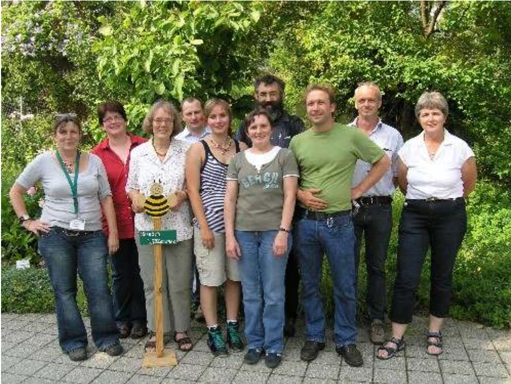
Abb. 1: Die Mitarbeiterinnen und Mitarbeiter des Fachzentrums.