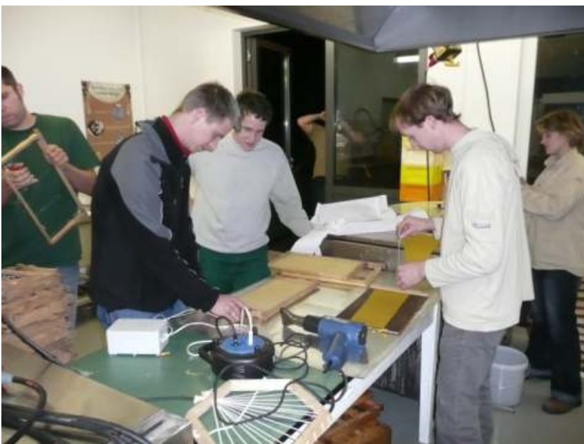
Abb.: 6: Wachskurs mit den Schülern des Wahlfachs Bienenhaltung

Zum Aufgabenbereich des Praxisbetriebs gehört auch der imkerliche Unterricht für das Wahlfach „Bienen“ des Schulbetriebes der Landesanstalt. Im praktischen Teil des Wahlfachs Bienenhaltung wurden 10 Schüler der Techniker- und Meisterklassen an den Bienenvölkern unterwiesen. Die erfolgreiche Teilnahme wurde mit einem von den Schülern selbstgebildeten Ableger belohnt!