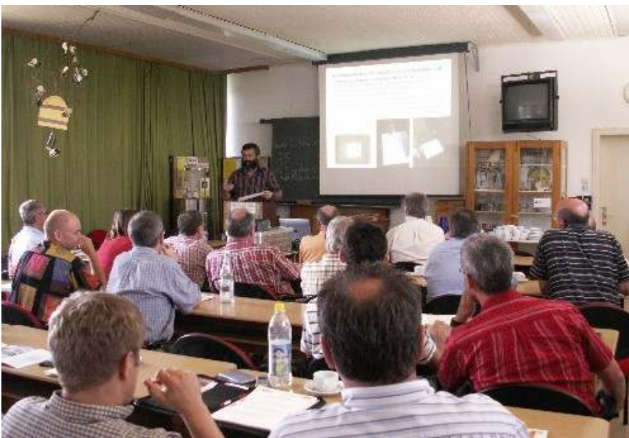
Abb. 15: Imkerschulen vermitteln Wissen für Anfänger und Fortgeschrittene.