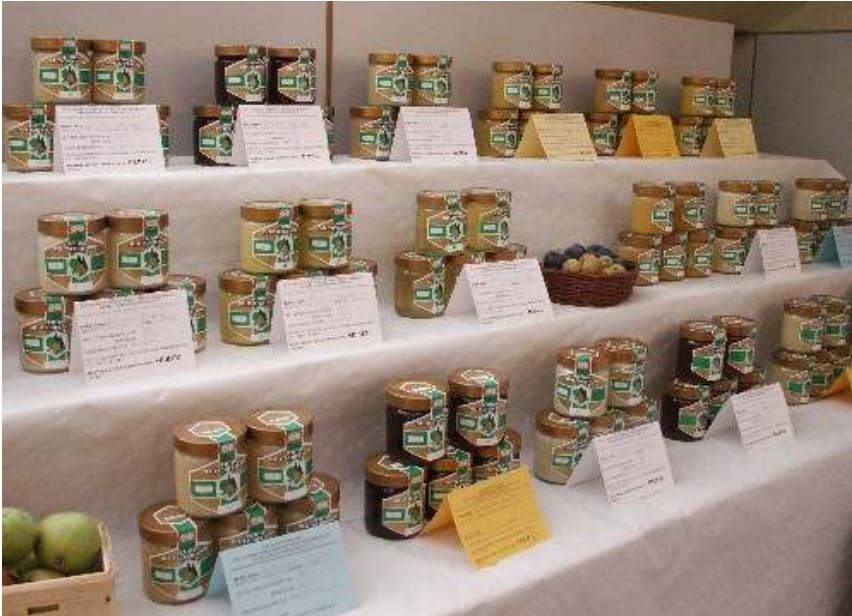
Abb. 7: Honigprämierungen gehören zu den angenehmsten Aufgaben.