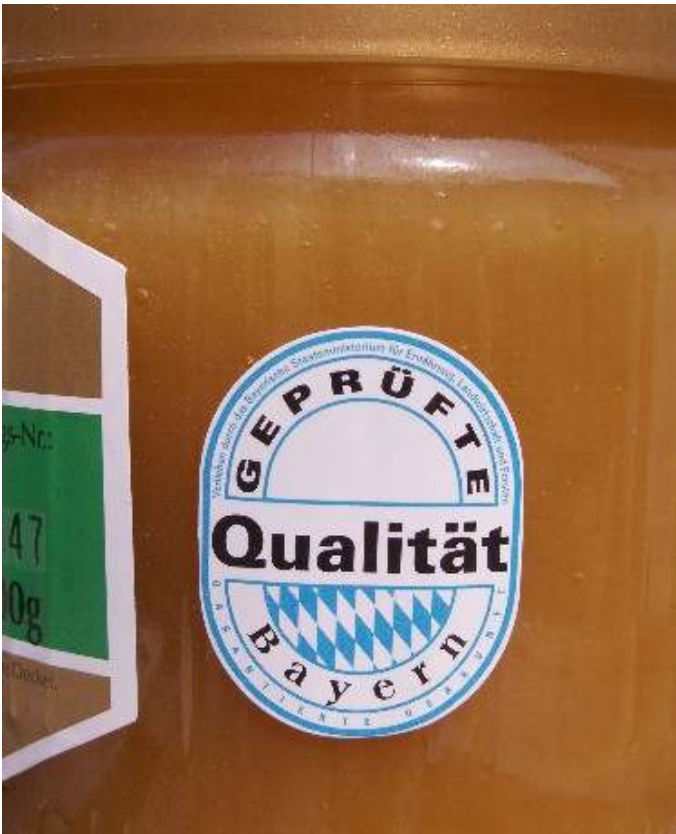
Abb. 13: Die „geprüfte Qualität Bayern“ zeichnet sich mit einem attraktiven Siegel aus.