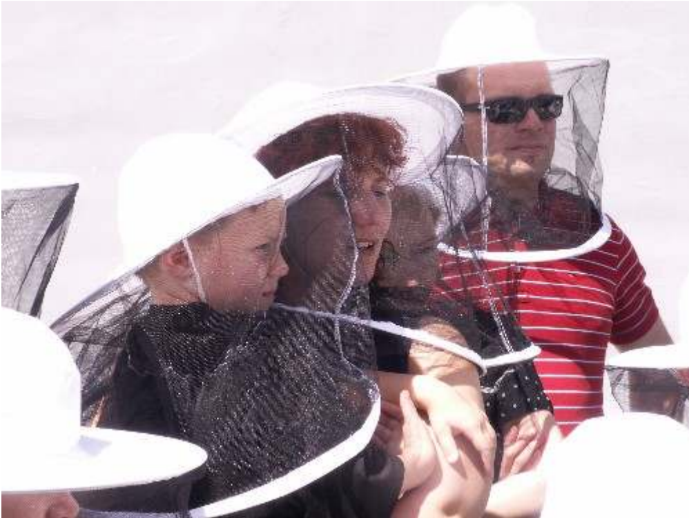
Abb. 4: Gespannte Aufmerksamkeit: die ganze Familie bei der Vorführung am Kindermuseum Nürnberg

Neben zahlreichen Anfragen durch Presse und Rundfunk vor allem zu den Themen Bienengesundheit gab es auch mehrere Drehtermine mit Film- und Fernsehgesellschaften . Erfreulich, dass inzwischen auch imkereipositive Themen aufgegriffen werden. So wurde zum Beispiel mit einem Team der Nürnberger Nachrichten eine Videoreportage zum Thema „Honigernte im Selbstversuch“ erstellt. Am Walderlebniszentrum Tennenlohe bei Erlangen erlebte ein Reporter die faszinierende Welt der Bienen für zahlreiche Internetnutzer! Der 6-Minuten-Clip soll vor allem Jugendliche ansprechen und stellt ein Beispiel für die Nutzung der neuen Medien in der Imkerei dar ( http://video.nordbayern.de/ Suchbegriff: Honigernte). Das Walderlebniszentrum Tennenlohe, eine der erfolgreichsten und ältesten umweltpädagogischen Einrichtungen in Bayern, wurde nicht ohne Grund für die Aktion ausgewählt. Seine Mitarbeiter werden durch den dort ansässigen Fachberater geschult, so dass die Bienen inzwischen in das Führungsangebot eingebaut wurden ( www.walderlebniszentrum-tennenlohe.de ).