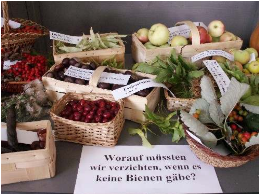
Abb. 3: Bienen und Bestäubung – ein wichtiges Thema für jede Gartenschau.

Ein besonders naturinteressiertes Publikum findet sich jeweils auf den Gartenschauen ein. So waren wir auf der Kleinen Gartenschau in der „Blumenstadt“ Rain am Lech im Herzen Schwabens mit Empfehlungen zu Bienenweide und Trachtverbesserung sowie allgemeiner Information rund um Biene und Bienenvolk zu Gast.