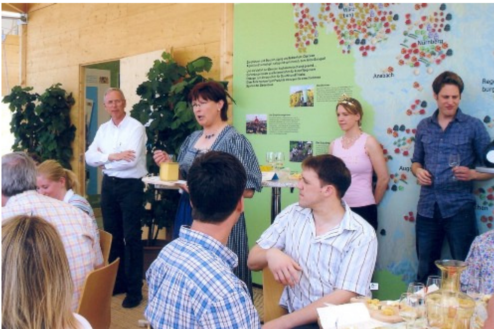
Bundesgartenschau (BuGa) München: Präsentation „Käse und Wein“

Ein weiterer Schwerpunkt des vergangenen Jahres war die intensive Beteiligung mit weinbaulichen Themen an der Bundesgartenschau in München. An sieben Wochenenden wurde mit Unterstützung des Fränkischen Weinbauverbandes die Thematik „Essen und Wein“ an folgenden Beispielen deutlich gemacht: Spargel und Wein, Brot und Wein, Käse und Wein, Fisch und Wein, Feines vom Schwein und Wein, Wild und Wein. Die Veranstaltungsreihe traf in besonders effektiver Weise den Trend der Zeit, die große Zahl der begeisterten Teilnehmer unterstrich die Aktualität des Angebotes.