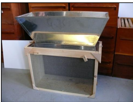
Kunstschwarmkiste m Trichter

Je nach Jahreszeit und Verwendung etwa 1 – 2,5 kg Bienen in Kunstschwarmkiste (mit Lüftungsgitter und Futtereinrichtung) befördern.