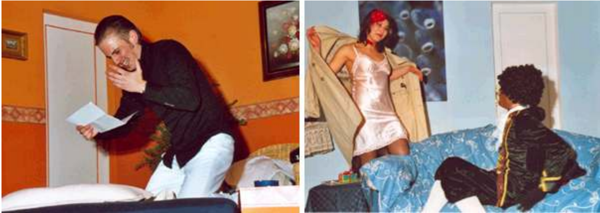
Bilder 5 und 6: Theatergruppe mit dem Stück „Otello darf nicht platzen“

Sehr erfolgreich waren wieder die Vorstellungen der Theatergruppe. Unter der Regie von Günter Stadtmüller kam die Komödie "Otello darf nicht platzen" von Ken Ludwig zur Aufführung. Bei insgesamt fünf Vorstellungen mit jeweils mehr als 100 Besuchern wurden die großartigen schauspielerischen Fähigkeiten der Studierenden mit viel Applaus bedacht.