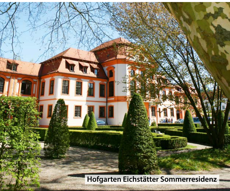
Hofgarten Eichstätter Sommerresidenz

Gartengästeführer erweitern das touristische Angebot ihres Umfeldes um einen wertvollen Aspekt. Durch fundiertes Fachwissen und regionale Kenntnisse wird jede Führung zu einem besonderen Erlebnis. Neben öffentlichen Parks, botanischen Gärten, Schlossgärten, Privatgärten und Gartenschauen sind erlebnisorientierte Führungen auch in Gartenbaubetrieben denkbar, um die Vorteile einer qualitätsorientierten Arbeitsweise und regionalen Produktion einem möglichst großen Interessentenkreis nahe zu bringen.