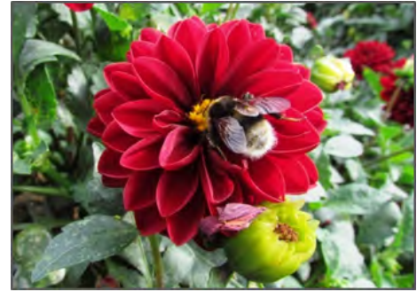
Dahlia 'Dalaya Goa'

Es gilt die Annahme, dass Pflanzen mit gefüllten Blumen keine Attraktivität für Bienen haben. Dies ist jedoch nicht so pauschal zu bewerten, da auch gefüllt blühende Pflanzen noch Staubgefäße mit sichtbaren Pollen und / oder Nektar bilden können, welche als Futterquellen für Bienen attraktiv sind.