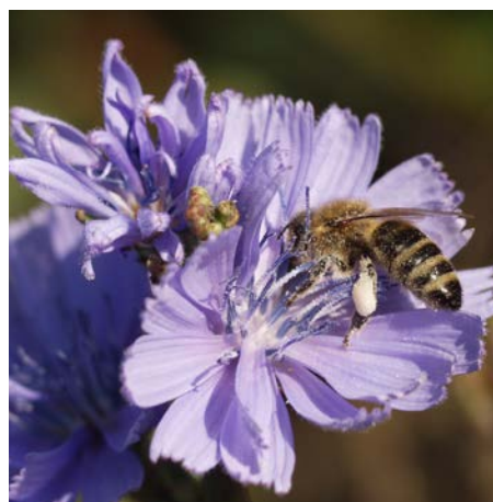
Bild 6: Gerade für Honigbienen (hier auf einer Wegwarte) bieten die WPM reichlich Nektar und Pollen.