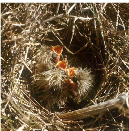
Bild 5: Die Brutnachweise für Feldlerchen haben sich in WPM vervielfacht.