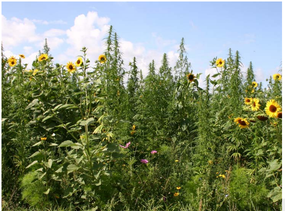
Bild 1: Der Veitshöchheimer Hanfmix im 1. Standjahr, geprägt von Faserhanf, Cosmeen und Sonnenblumen.

Rebhuhn und Feldlerche in den Ackerlandschaften zwangen zum Handeln. Nach der Artensichtung und Abstimmung der Artenliste mit dem Bundesamt für Naturschutz begannen umfangreiche Feldversuche in Bayern, Niedersachsen und Brandenburg.