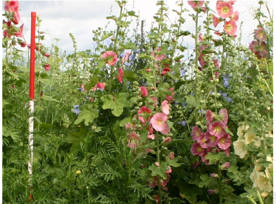
Bild 2: Im 2. Standjahr prägen Stockrosen, Fenchel und Wegwarte das Bild des Hanfmix, im Unterwuchs ist der Massenträger Rainfarn zu sehen.

Gesät wird die Mischung zeitgleich mit Mais. Die Frühjahrstrockenheit führte ab und an zu Misserfolgen. Deshalb wurde zur Erhöhung der Anbausicherheit eine zweite Mischungsvariante ohne einjährige Arten entwickelt, die im Sommer nach der Standardkultur (im Regelfall Getreide) gesät wird. Diese ist heute als BG 90 im Handel. Bei beiden Mischungen dürfen einige Probleme im Anbau nicht unerwähnt bleiben: