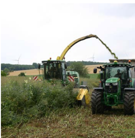
Bild 3: Die Ernte der Wildpflanzenmischung erfolgt nach den Brut- und Setzzeiten der Wildtiere.

Ergebnis der Bundesversuche war die WPM „Biogas 1“, heute als BG 70 im Handel. Sie besteht aus 25 Arten, nämlich einjährigen Kulturpflanzen wie Sonnenblumen und Buchweizen, die als Ammenpflanzen für die mehrjährigen Arten dienen, zweijährigen Arten wie Steinklee, Wilde Möhre und Wegwarte sowie mehrjährigen heimischen Wildpflanzenarten wie Luzerne, Beifuß und Rainfarn. Geerntet wird BG 70 im ersten Standjahr ab Mitte August bis Mitte September und ab dem zweiten Standjahr in der ersten Julihälfte.