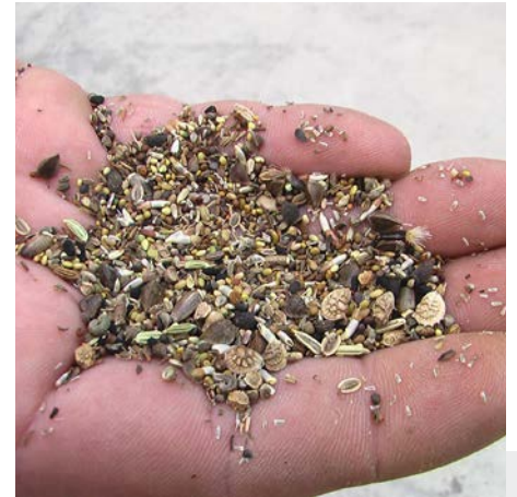
Bild 4: Das Wildpflanzensaatgut ist sehr heterogen, es wird deshalb obenauf gelegt und angewalzt.

Was Jäger besonders interessiert, sind die Auswirkungen auf die Wildtiere. Die positiven Effekte wurden durch umfangreiche faunistische Begleituntersuchungen eindeutig belegt. Nektar- und Pollensammler wie Honig- und Wildbienen profitieren von den blütenreichen Beständen in einer Zeit, in der in der Feldflur sonst wenig zu holen ist. Wo die Insektenpopulationen zunehmen, werden zahlreiche Feldvögel und auch Fledermäuse angelockt. Auf einer Versuchsfläche in Brandenburg