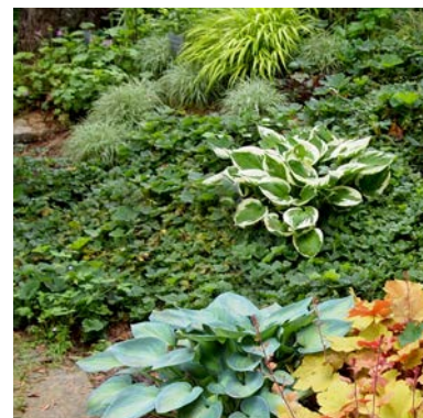
Hosta und Heuchera