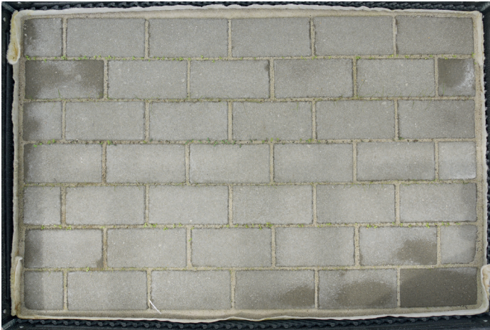
Bild 4: Kümmernde Keimlinge auf gealtertem Dorfnert Fugensand+ bei feuchten Bedingungen (Aufnahme 27.05.2010, Palette 18)