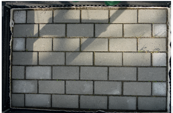
Bild 7: Auf Brechsand können sich dagegen selbst in der trockenen Variante einige Sämlinge ansiedeln (Aufnahme 21.04.2010, Palette 41)