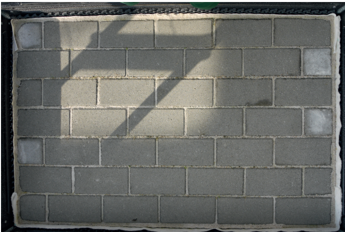
Bild 6: In der trockenen Variante bleiben die Parzellen mit Dorfnert Fugensand+ beinahe vegetationsfrei (Aufnahme 21.04.2010, Palette 42)