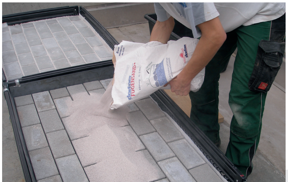
Bild 1: Aufbringen des Fugensandes (Aufnahme 21.01.2010)

Da sich in den Fugen vieler Pflasterflächen durch Samenflug bereits kurz nach der Herstellung unerwünschte Gräser und Kräuter ansiedeln, könnte Dorfner Fugensand+ Pflegekosten einsparen, wenn der enthaltene Zusatzstoff Keimung und Weiterentwicklung des unerwünschten Aufwuchses verhindert bzw. reduziert.