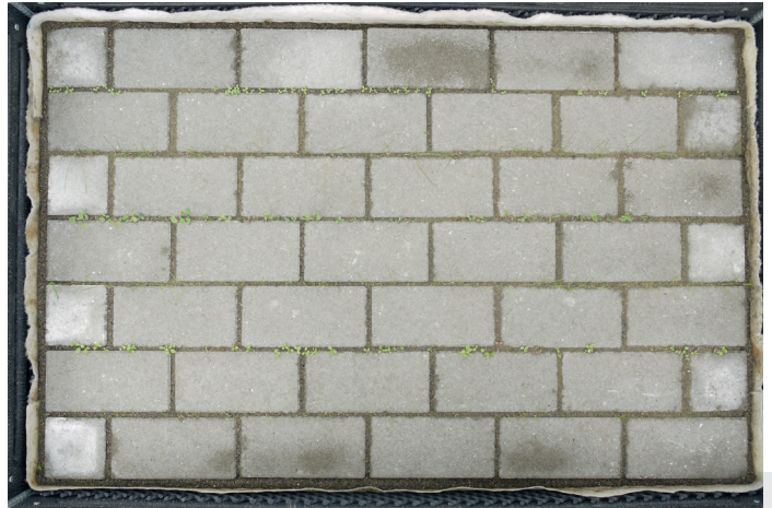
Bild 5: Auf gealtertem Brechsand sind die Pflanzen dagegen unter feuchten Bedingungen größer und kräftiger (Aufnahme 27.05.2010 Palette 17)