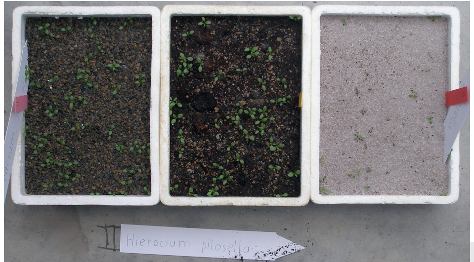
Bild 3: Saatschalen mit Hieracium pilosella (kleines Habichtskraut) v.l. auf Brechsand, Torf-Kultur-Substrat und Dorfner Fugensand+ (Aufnahme 13.01.2010 – 21 Tage nach Ansaat)

Nach gut zwei Monaten wurde das Fugenmaterial zwischen den Pflastersteinen 1 cm tief entfernt und durch künstlich gealterte Sande ersetzt, die zuvor mit Schluff und Laubkompost vermischt worden waren. Danach begannen die Keimversuche von neuem.