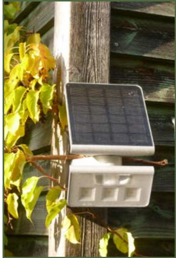
Bild 2: Die Firma Steinel verspricht für Ihr Modell Xsolar L-S zwei Monate Leuchtkraft auch ohne Sonneneinstrahlung.

So sollte ein nachhaltig arbeitender GaLaBau-Unternehmer im Bedarfsfall das Thema Tropenholz thematisieren und Alternativen aufzeigen. Auf so einer Beratungs-Checkliste sollten ebenfalls die Themen torffreie Substrate, regionale Natursteine, Verzicht auf chemische Pflanzenschutzmittel, energiesparende LED-Beleuchtung, Einsatz von Solar-Lampen, ressourcenschonende Bewässerung mit Regenwasser und natürlich – wir sind Gärtner – standortgerechte Pflanzenverwendung im Zeichen des Klimawandels stehen.