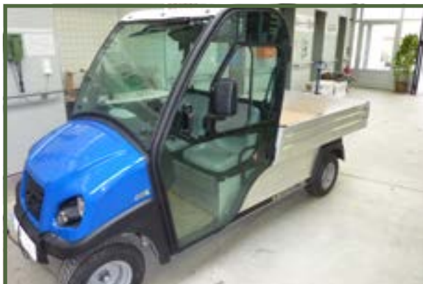
Bild 3: Kleine Elektrotransporter für kurze Strecken stehen bereits zur Verfügung.

Die Ladekapazität der Akkus, die die Verbreitung von elektrisch betriebenen Pkw's behindert, dürfte dabei im GaLaBau kein großes Hindernis sein, denn so