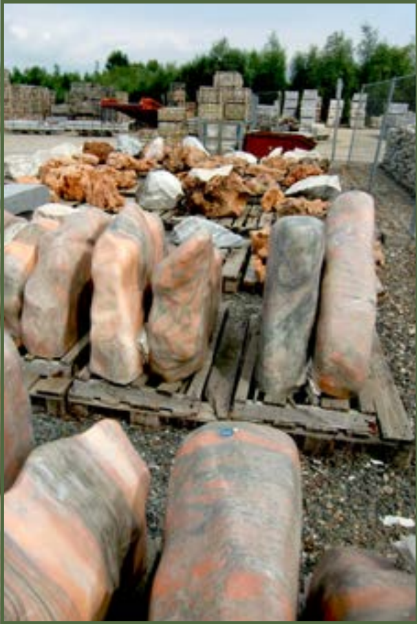
Bild 1: Die Vielfalt der Gesteine aus aller Herren Länder im Natursteinhandel muss nicht in den Garten übertragen werden.